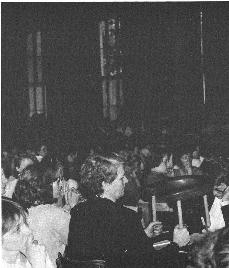
Analyse critique de la chaise d'accouchement

Redaktionsschluss am ersten des Vormonats Clôture de la rédaction le 1 er du mois précédent