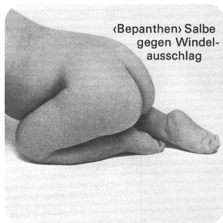
«Bepanthen» Salbe gegen Windel- ausschlag