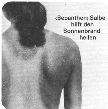
«Bepanthen» Salbe hilft den Sonnenbrand heilen