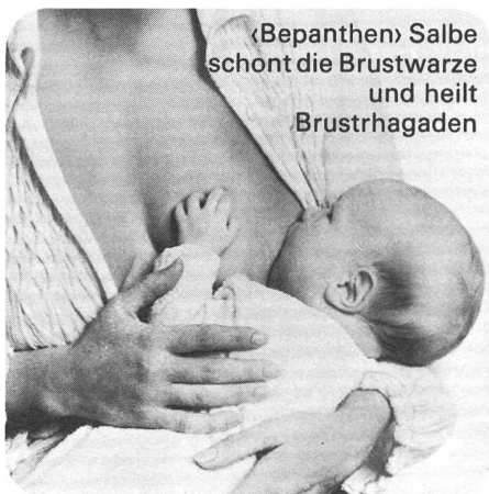
«Bepanthen» Salbe schont die Brustwarze und heilt Brusthagaden