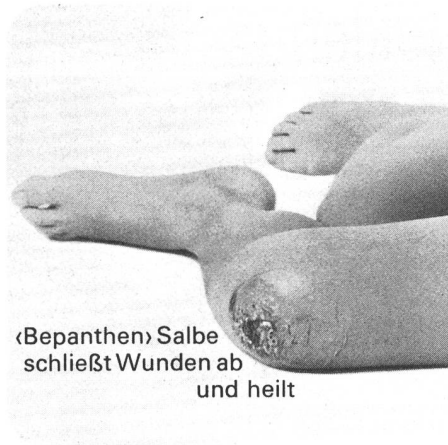
«Bepanthen» Salbe schließt Wunden ab und heilt