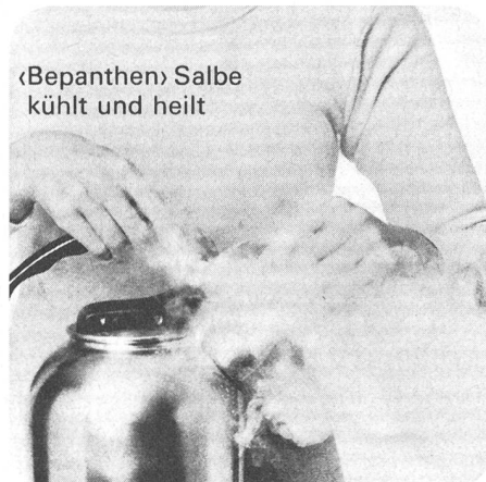
«Bepanthen» Salbe kühlt und heilt