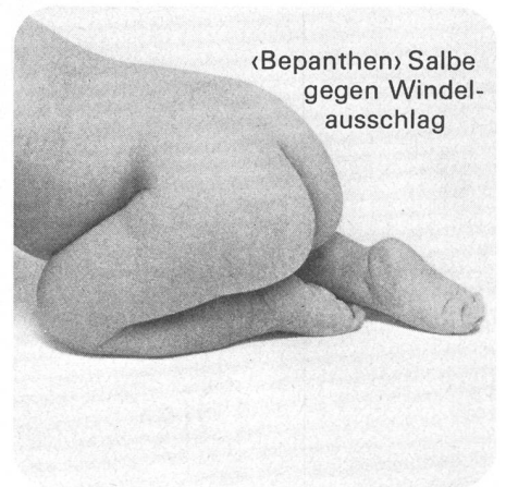
«Bepanthen» Salbe gegen Windel- ausschlag