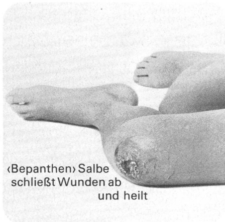
«Bepanthen» Salbe schließt Wunden ab und heilt