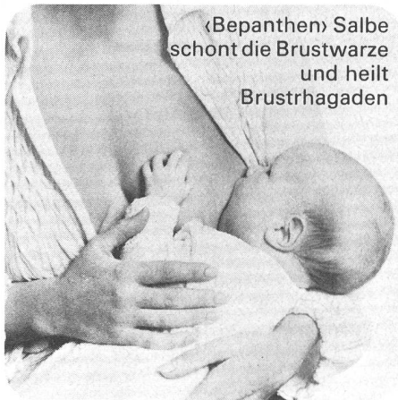
«Bepanthen» Salbe schont die Brustwarze und heilt Brusthagaden