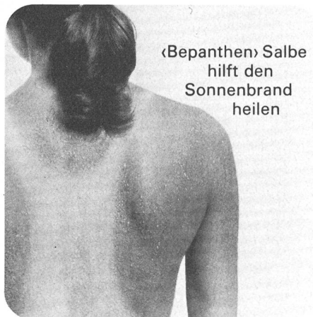
«Bepanthen» Salbe hilft den Sonnenbrand heilen