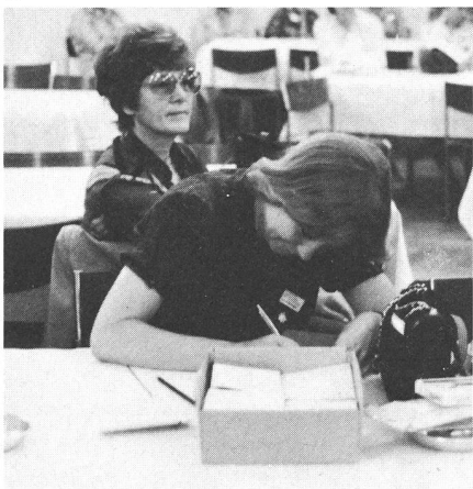
1 Aufmerksame Zuhörerinnen Auditrices attentives