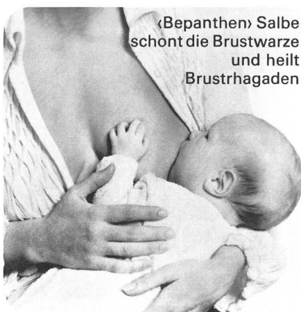
«Bepanthen» Salbe schont die Brustwarze und heilt Brusthagaden