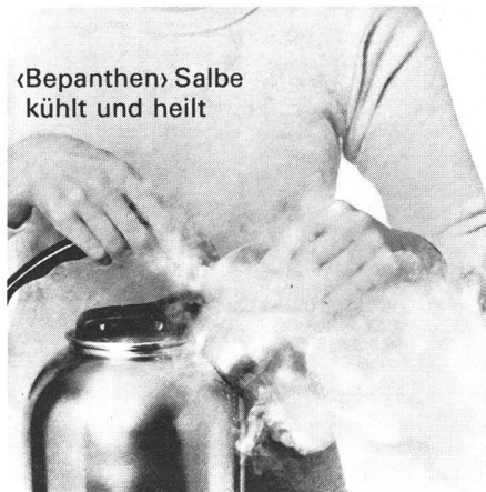
«Bepanthen» Salbe kühlt und heilt