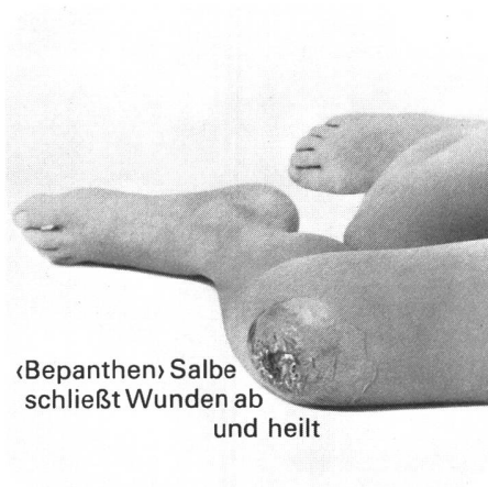
«Bepanthen» Salbe schließt Wunden ab und heilt