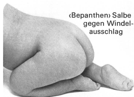
«Bepanthen» Salbe gegen Windel- ausschlag