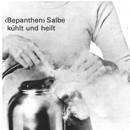
«Bepanthen» Salbe kühlt und heilt