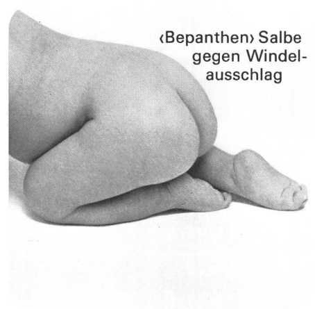
«Bepanthen» Salbe gegen Windel- ausschlag