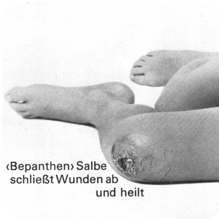
«Bepanthen» Salbe schließt Wunden ab und heilt