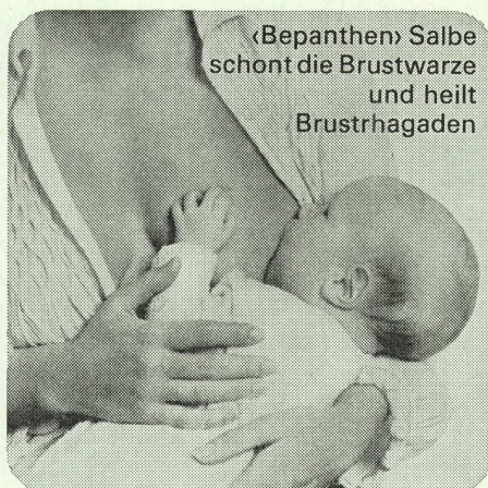
«Bepanthen» Salbe schont die Brustwarze und heilt Brusttragaden