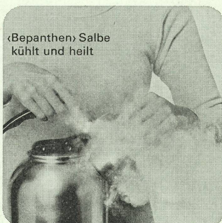
«Bepanthen» Salbe kühlt und heilt