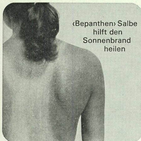
«Bepanthen» Salbe hilft den Sonnenbrand heilen