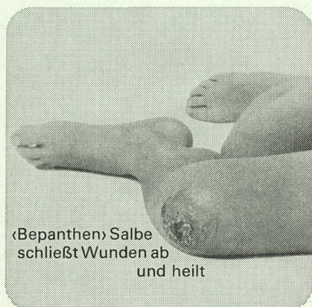
«Bepanthen» Salbe schließt Wunden ab und heilt