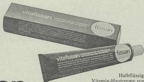
Halbflüssige Vitamin-Hautcreme zum Aufbau der Gewebe.

Kompakt in der Tube, verflüssigt sich diese Vitamin-Creme beim Auftragen. Vitafissan empfiehlt sich zum Vorbeugen von Dermatosen bei besonders anfälliger Haut von Säuglingen, Kindern und Erwachsenen.