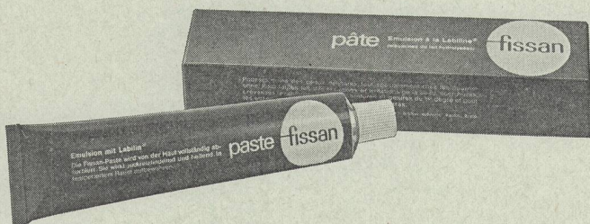
Haut-Heilmittel mit hervorragenden kurativen Eigenschaften.

Nur in Apotheken und Drogerien erhältlich.