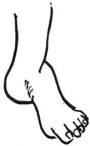
Abb. 4 Hohlfuß

Jahren fehlt, abnorm stark ausgebildet (Abb. 4). Der Säuglingsfuß sieht dann bereits wie ein normaler Erwachsenen-Fuß aus. Die anfänglich oft nur schwach ausgebildete Deformierung nimmt im