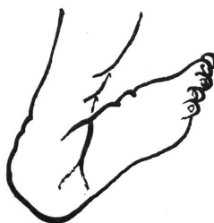
Abb. 2 Hackenfuß

Bei dieser Fußdeformität handelt es sich um das Gegenteil des Klumpfußes (Abb. 2). Sie kommt recht häufig vor. Die Ursache ihrer Entstehung ist ebenfalls nicht bekannt. Möglicherweise spielt in einigen Fällen die Lage des Fußes in der Gebärmutter eine Rolle. Der Fuß ist nach außen gedreht und der Fußrücken berührt nahezu die Vorderseite des Unterschenkels. Die Weichteile am Fußrücken sind straff und verkürzt, und die Spannung der verkürzten Sehnen verhindert die Abwärtsbewegung des Fußes.