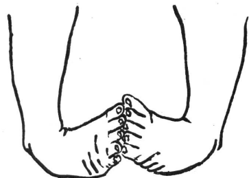
Abb. 1 Klumpfüße

Die Erkennung dieser Deformität ist sehr leicht (Abb. 1). Sie kann fast nicht übersehen werden. Im Gegensatz zur angeborenen Hüftausrenkung - bei der man übrigens die Diagnose auch in den