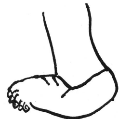
Abb. 3 Plattfuß

Diese Fußdeformität ist sehr selten und für Hebamme und Säuglingsschwester von untergeordneter Bedeutung. Sie ist fast so auffällig wie der Klumpfuß und kann daher kaum übersehen werden (Abb. 3). Der Fuß sieht einer Walze oder einer Löschpapierschaukel ähnlich, indem die Ferse hoch steht und der Vorfuß nach oben schaut. Es handelt sich um eine recht schwere Deformierung des Fußes, die eine frühzeitige Behandlung verlangt, wenn der Behandlungserfolg gut sein soll. Der Fuß wird mit den Händen umge-