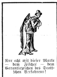
Nur echt mit dieser Marke dem Fische — dem Garantiezeichen des Scotts- schen Verfahrens!

Zu Versuchszwecken lie- fern wir Hebammen gerne 1 große Probe- flasche umsonst und postfrei. Wir bitten, bei deren Bestellung auf diese Zeitung Bezug zu nehmen