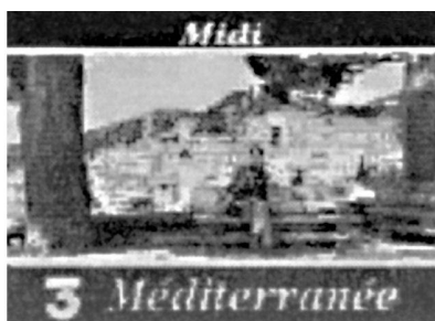
Abb. 1: Bormes les Mimosas in der Sicht von Midi-Méditerranée – acht Ausschnitte. Kommentare im Original auf französisch.