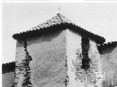
Bild: Feste Einstellung auf das Dorf.

Kommentar: Wir können hier nicht 20 Jahrhunderte Geschichte zusammenfassen ...