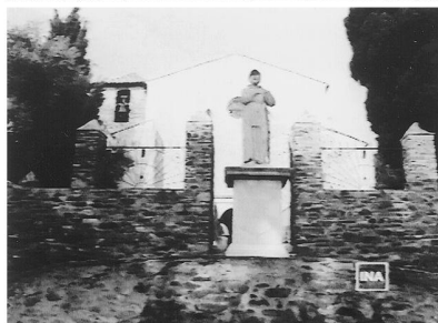
Bild: Grossaufnahme des Turms, dann Rückwärts-Zoom.

Kommentar: Am Ende des letzten Jahrhunderts ...