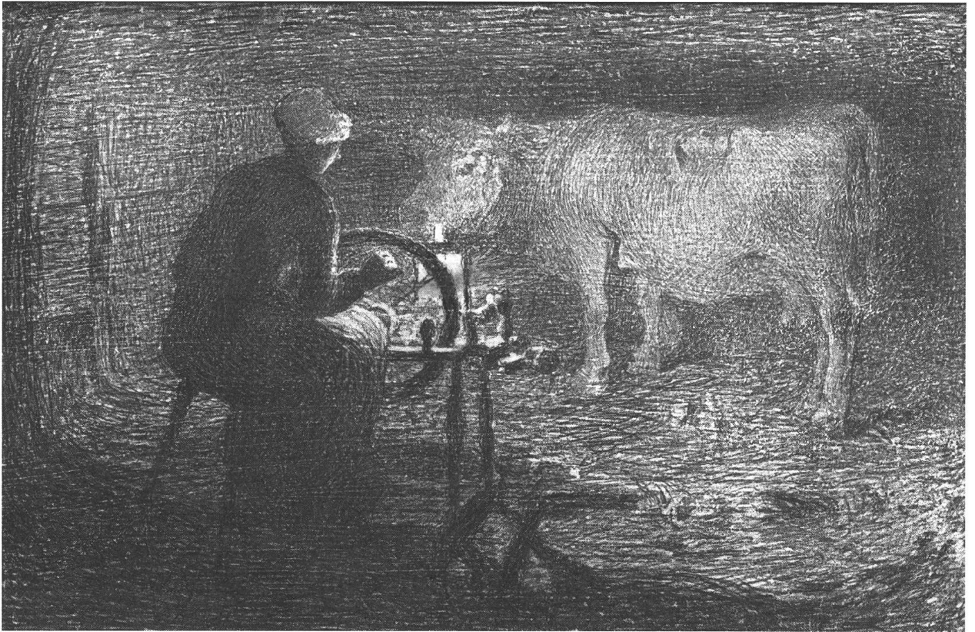
Donna all'arcolaio , disegno di Giovanni Segantini.