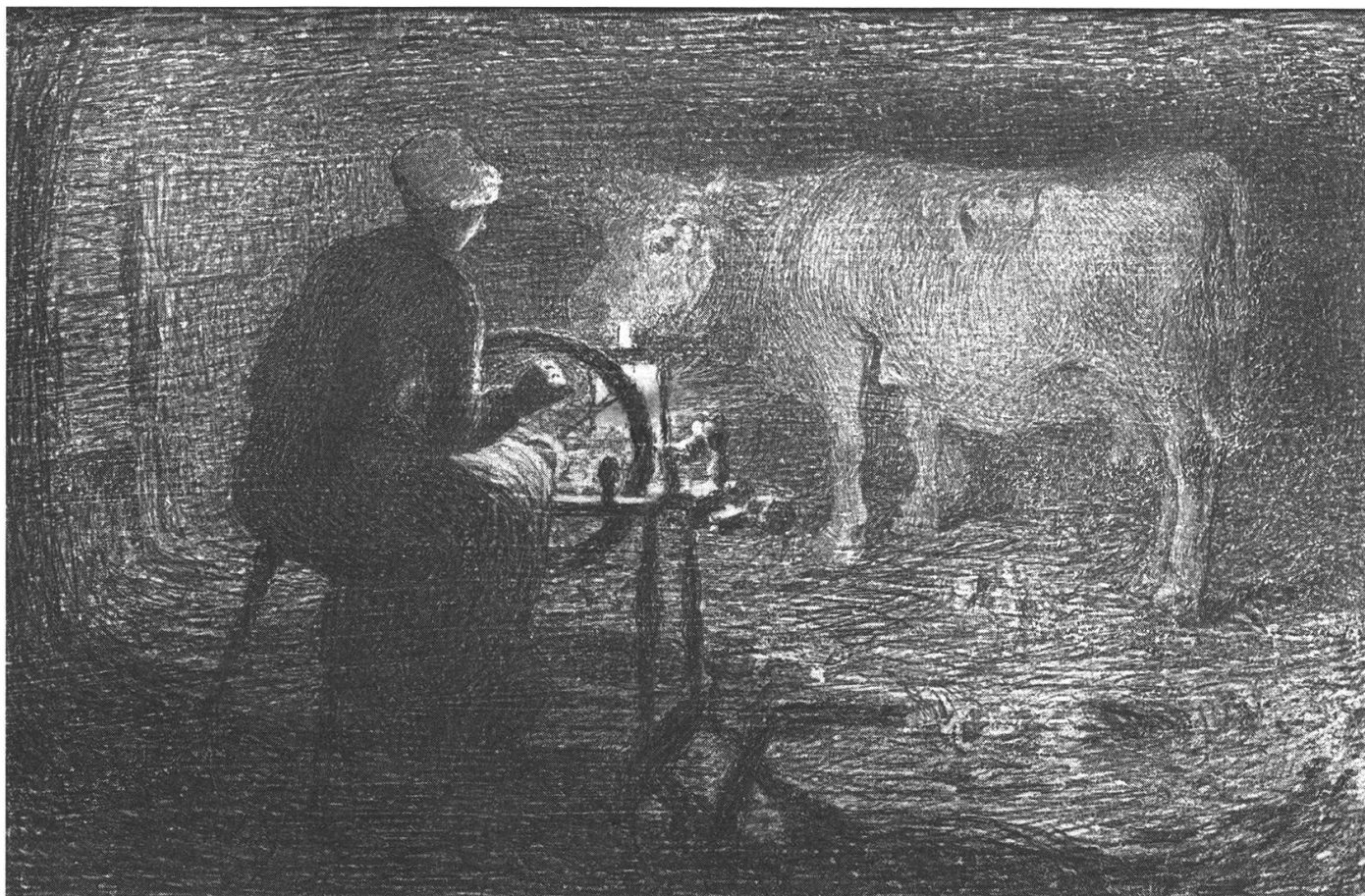
Donna all'arcolaio , disegno di Giovanni Segantini.