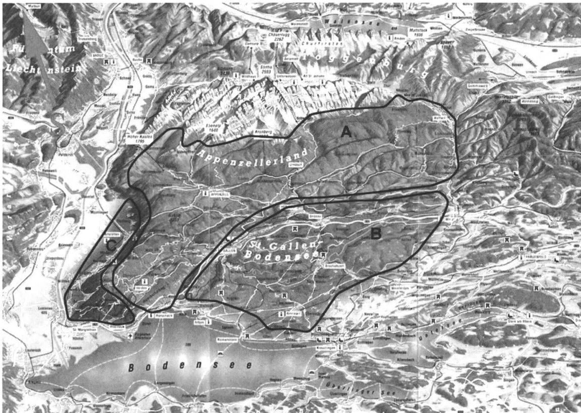
Abb. 3: Die landwirtschaftlich unterschiedlichen Zonen in der spätmittelalterlichen Region Ostschweiz: A = Viehwirtschaft; B = Getreidebau; C = Weinbau.