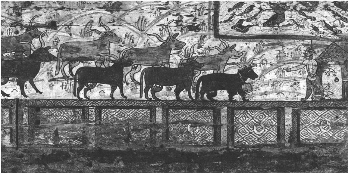
Abb. 1: Bohlenmalerei des 16. Jahrhunderts aus einem abgebrochenen Haus in Gais AR. Maler unbekannt. Stiftung für appenzellische Volkskunde, Herisau, ausgestellt im Volkskunde-Museum Stein AR.

sogenannten Bauernmalerei des 18. und 19. Jahrhunderts (Abb. 2). Sie zeigt die Ankunft der Kuhherde auf der Alp, wo die Tiere für einige Wochen geweidet werden, bevor sie wieder ins Tal zurückkehren. Diese Malerei wirft ein Schlaglicht auf die grosse Bedeutung der Viehwirtschaft in der Geschichte der Ostschweiz. Ziel dieses Beitrags ist, zu zeigen, dass die ostschweizerische Alpwirtschaft einen wichtigen Anteil an der seit dem ausgehenden Mittelalter bereits stark kommerzialisierten und immer intensiver geförderten Viehwirtschaft hatte. Unter dem Begriff Alpwirtschaft wird der auf die Sommermonate beschränkte Aufenthalt des Viehs mit Hirten auf den Bergweiden verstanden. Dabei handelt es sich um eine von der Hauptsiedlung weitgehend abgesonderte Betriebsweise, die aber mit dieser in einem rechtlichen und wirtschaftlichen Zusammenhang steht. 1 Zeitlich wird ein Bogen vom 15. ins 16. Jahrhundert geschlagen. Als Quellengrundlage dienen hauptsächlich Pergamenturkunden und Alpsatzungen, ergänzt durch die historische Literatur. Thematisiert werden nebst der rechtlichen Organisation der Alpwirtschaft auch die Produktion und der Handel von Alpprodukten, denn Käse, Butter und Vieh dienten der Versorgung der gesamten Bevölkerung, das heisst der ländlichen wie der städtischen. Am Beispiel der Alpwirtschaft kann gut gezeigt werden, wie eng die ländliche, voralpine/alpine Wirtschaft des Mittelalters und der Frühen Neuzeit mit jener von städ-