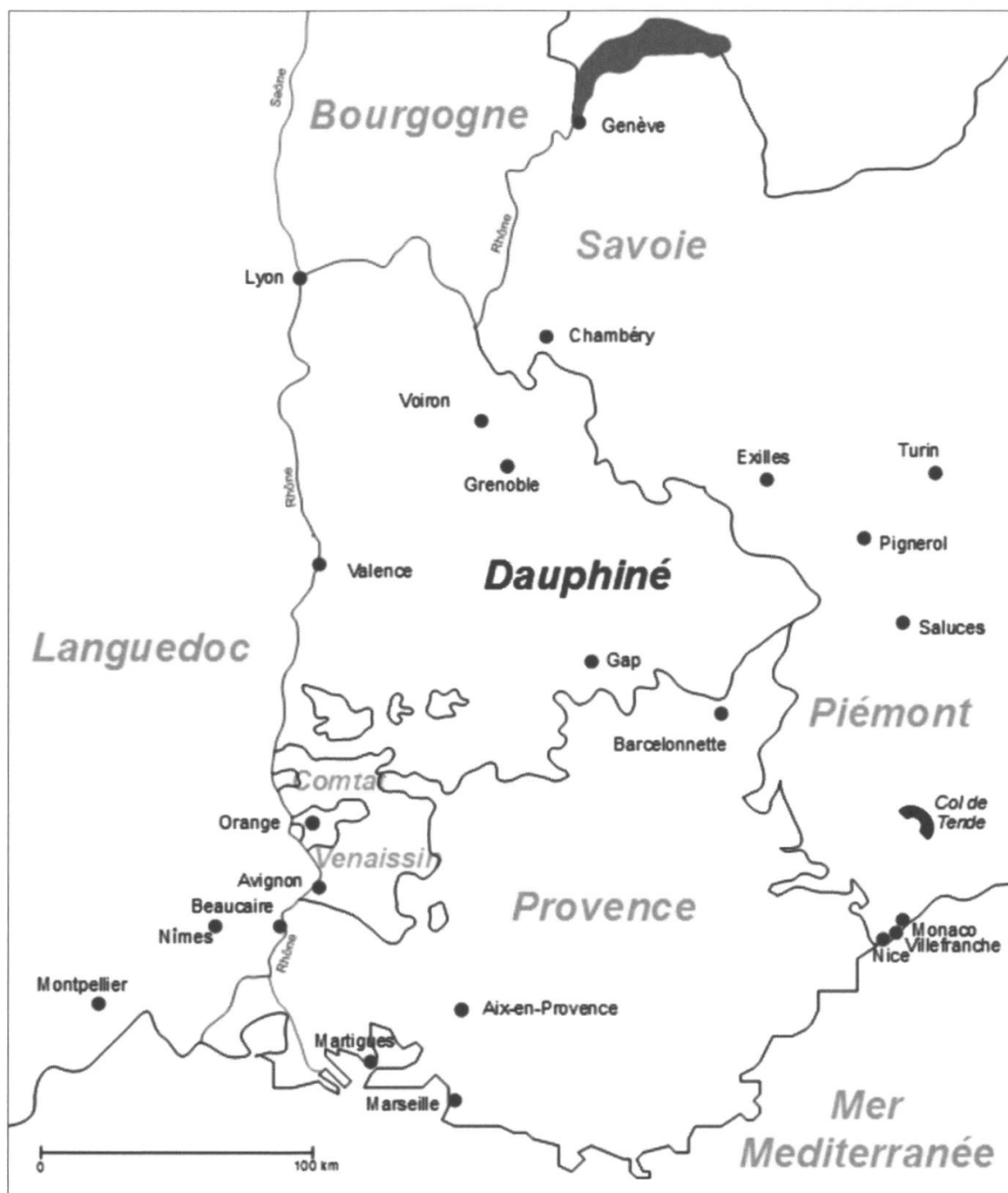
Carta 1: Il Delfinato e i suoi vicini nel XVIII secolo. Carta realizzata da Hubert Proal.

La prima parte di questo contributo analizza la dialettica tra «frontiera imposta» e «frontiera vissuta», esaminando le conseguenze del trattato di Utrecht (1713) sull'Alto Delfinato. La seconda parte dell'articolo è dedicata alla questione del controllo del confine, attraverso l'esempio della lotta condotta negli anni