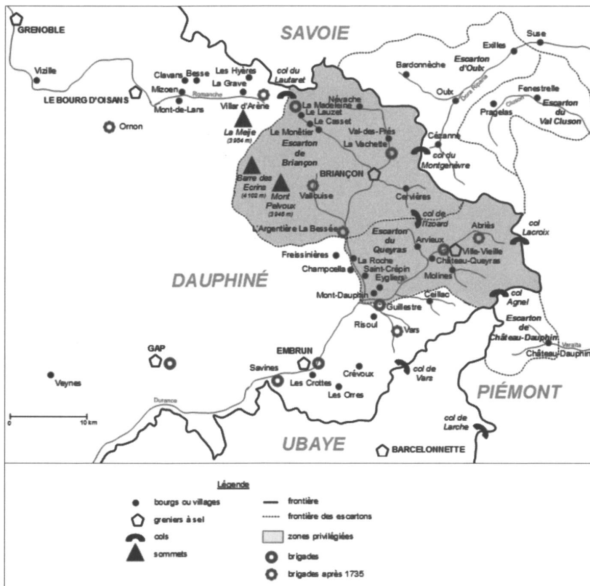
Carta 2: Il Brianzonese dopo Utrecht (1713). Carta realizzata da Hubert Proal.

della città, comportando altresì qualche vantaggio dal momento che i cantieri di costruzione delle piazzeforti fornirono opportunità di lavoro ai contadini e agli artigiani della Guisane e della Clarée (ma anche a Piemontesi e Savoiard). Inoltre, l'approvvigionamento delle truppe che vi sono alloggiate – fu facilitato dalla costruzione di nuove strade carrozzabili – stimolò la circolazione stradale a beneficio degli abitanti della Valle della Durance. 6 Gli anni successivi al trattato di Utrecht furono tuttavia segnati, soprattutto a livello provinciale, dalla chiusura progressiva e pressoché totale del mercato piemontese ai fabbricanti di tessuti del Delfinato. Infatti, sin dai primi anni del XVIII secolo ma soprattutto