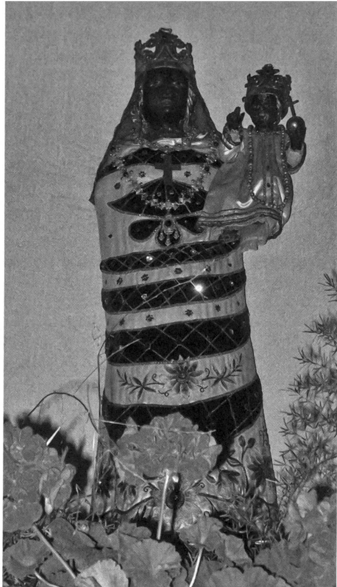
Fig. 2: Statua della Madonna Nera presente nella Chiesa-Santuario di Kuppelwies (Pracupola) in Ultental (Val d'Ultimo). Foto degli autori.

di pellegrinaggi continui: la potenza attrattiva di questo particolare genere di Madonna permane tutt'oggi nel popolo dei fedeli cristiani. Nelle Alpi centrali ed orientali, si conta la presenza di questo culto in diverse zone (Alta Valtellina, Val Monastero, Valli Giudicarie, Valle del Sarca, Val d'Adige, Val di Non, Alta Val di Non, Valle d'Ultimo, Val Venosta, Val Senales, Oetzthal) dove sono stati eretti nei secoli chiese e santuari che hanno trasformato la percezione del paesaggio stesso e delle vie di passaggio. 15 La figura della Madonna Bruna è enigmatica sia nel suo simbolismo, poiché richiama ad archetipi lontani, sia nella sua rappresentazione: rigida e spesso avvolta da una dalmata preziosa, mostra solo il volto, a volte una mano, e dallo stesso mantello sbucca il bambino, anch'esso il più delle volte con il volto scuro. Molto diverse dalle Madonne,