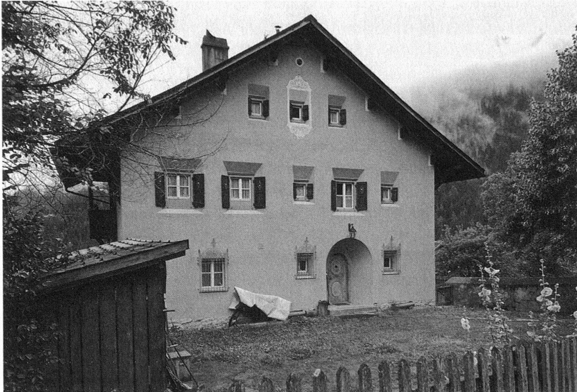
Abb. 1: Die Rhätische Bahn war immer wieder ein richtungweisender Bauherr. So mit ihren Wohnhäusern für die Bahnarbeiter im Heimatstil. Hier das «Ingenieurhaus» in Filisur von Meinrad Lorenz (1913).

kleinen Dorf Fläsch. Es ist ein verträumtes, steinaltes Haus mit einem Kachelofen, einem Garten und einem riesengrossen, leeren Stall. Hier erblicke ich wieder die Gebirgswelt wie in meiner Jugend, und gleichzeitig erlebe ich eine Baudynamik, die sich damals erst zu entfalten begann. Der Fuss der Alpen ist über die Strasse und die Eisenbahn mit der Metropole verbunden und wird zum Vorort. Morgens früh steige ich im Nachbardorf in den Zug, lese die Zeitungen und schaue in den werdenden Morgen; eine gute Stunde später sitze ich schon an meinem Arbeitstisch in der Redaktion meiner Zeitschrift in Zürich. Abends spät steige ich dort in den Zug und um Mitternacht bin ich zuhause. Oder ich bleibe gleich dort, verbunden mit der Metropole via Computer.