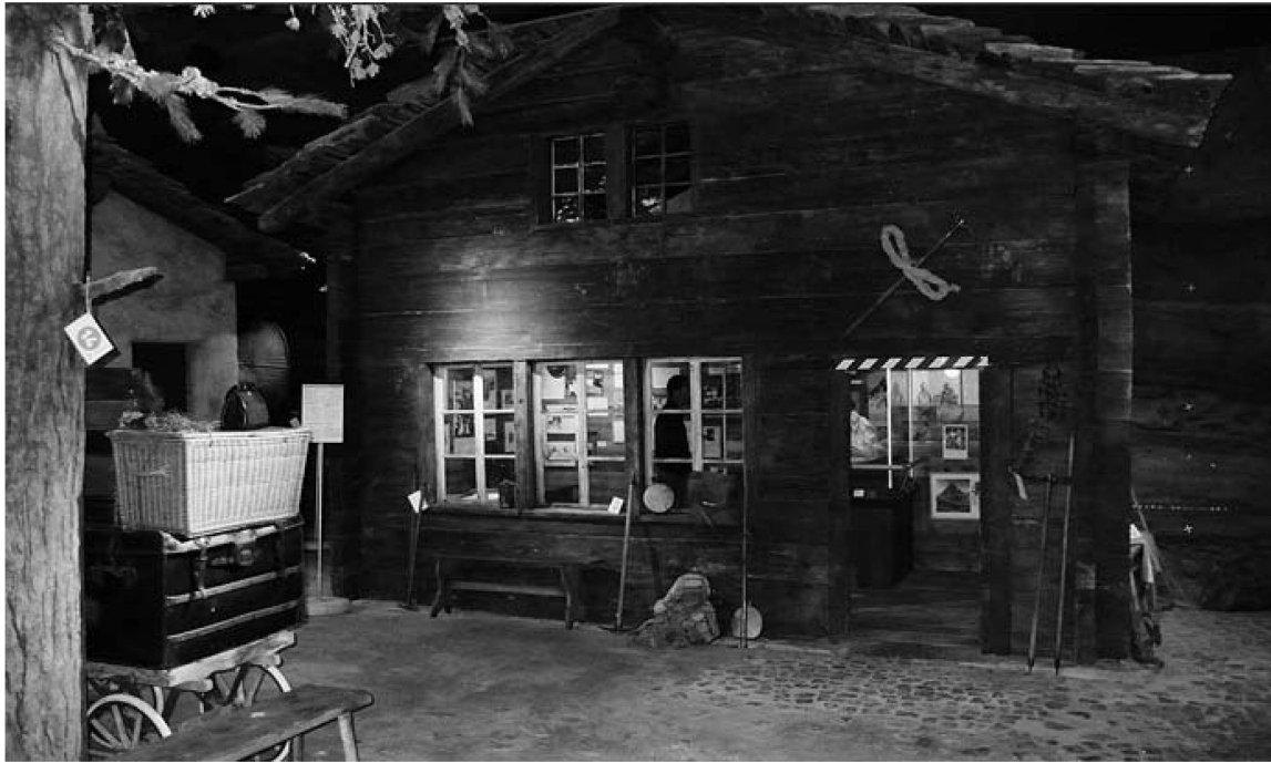
Abb. 2: Matterhorn Museum, Zermatt: der ehemalige Dorfplatz von Zermatt.

gelenkten Bergtourismus sind Neuorientierungen notwendig. Das Projekt Matterhornmuseum sowie die Neugestaltung des Gornergratgipfels sind Teil einer langfristig angelegten touristischen Neupositionierung, wie die Studie Leitbild «Zermatt 2015» zeigt. 22