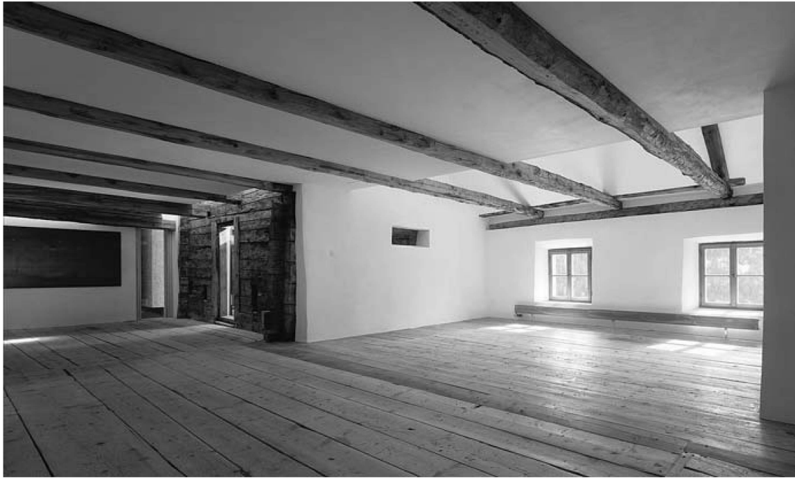
Abb. 1: Haus «Piz Tschüitta», Vnà: Aufenthaltsraum und Gästezimmer im Obergeschoss

Die umfangreichen Aufgabenbereiche umfassten die Neugestaltung des touristischen Auftritts (unter anderem Corporate Identity , Corporate Architecture , Leitsystem ) zu entwickeln, die drei für Besucher geöffneten Schauhöhlen mit Attraktionen auszustatten, und die Stationsgebäude sowie das Museum auf der Schönbergalm neu zu gestalten. So beginnt seit Mai 2008 der Ausflug von Obertraun am Hallstätter See zur Mammut-Höhle und Riesen-Eishöhle auf der Schönbergalm beim gläsernen Kassengebäude (über das sich das Dachstein Welterbe-Logo zieht) und führt mit grosszügigen Panorama-Seilbahnen zur Station Schönbergalm (mit adaptiertem Kassenbereich und einer Wartezone mit Infotainmentwänden). Der Weg zu den jeweiligen Höhleneingängen ist mit einem markanten Leitsystem gekennzeichnet.