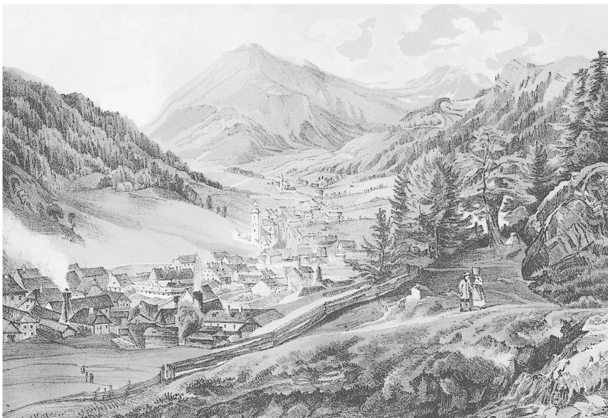
L'industria mineraria del Vordernberg, Stiria.

una produzione annua di circa 2200 tonnellate e con il laminatoio costruito nel 1792 a Lippitzbach, quelle della famiglia Egger a Triebach erano imprese di primo piano, grazie in particolare al loro elevato standard tecnologico.