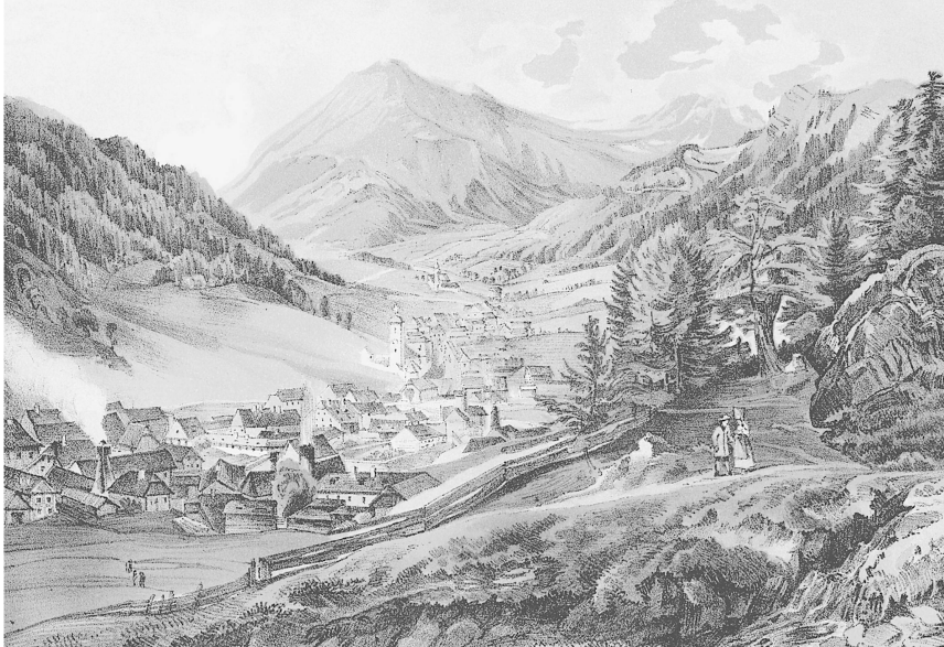
L'industria mineraria del Vordernberg, Stiria.

una produzione annua di circa 2200 tonnellate e con il laminatoio costruito nel 1792 a Lippitzbach, quelle della famiglia Egger a Triebach erano imprese di primo piano, grazie in particolare al loro elevato standard tecnologico.