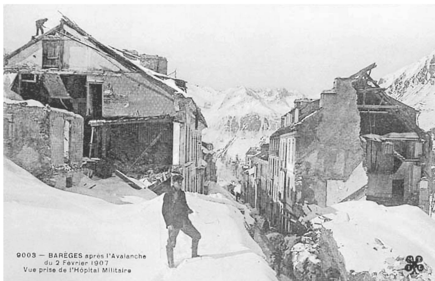
Fig. 1: Avalanche à Barèges en 1907.

dont la technique dérivait directement des systèmes de protection de l'architecture militaire du XVII e siècle. Les objectifs du plan régulateur de 1731 étaient non seulement esthétiques, mais aussi fonctionnels. Il insistait sur la nécessité de renforcer les protections commencées en 1714: le dispositif anti-avalancheux en amont des bains de Barèges, les digues contre les crues torrentielles. Pour sa part, le plan de 1818 proposait à nouveau un renforcement des systèmes de protection contre les avalanches et contre les crues prolongées jusqu'au nouvel hôpital. 16