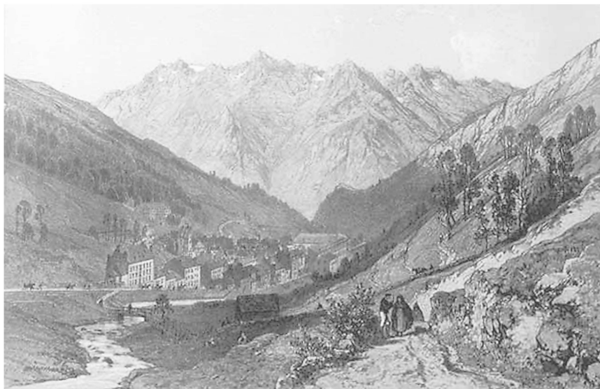
Fig. 2: Entrée de Barèges.

et quelques hommes seulement, gardiens de ce village abandonné, y restent jusqu'au printemps». 19 Les descriptions du milieu du XIX e siècle témoignent de la permanence de la pratique: «Les maisons n'ont qu'un étage et sont presque toutes bâties en bois, afin de pouvoir les démonter à l'entrée de l'hiver; car les habitants émigrent chaque année à cette époque, emportant avec eux leurs pauvres habitations, pour ne pas mourir de froid dans cette Laponie isolée du reste du monde. «Dès que le mois de septembre arrive – dit M. Jubinal – on démolit la plus grande partie des habitations pièce à pièce; on numérote leurs murailles factices, on étiquette leurs toits et leurs plafonds; et tout cela, semblable à une décoration de théâtre qu'on reporte au magasin après qu'elle a servi, est mis en réserve sous quelque couvert pour l'année suivante. Puis, dès que la primerose fleurit, les maisons repoussent blanches et neuves, et ayant toujours l'avantage de paraître avoir été conservées sous verre»». 20