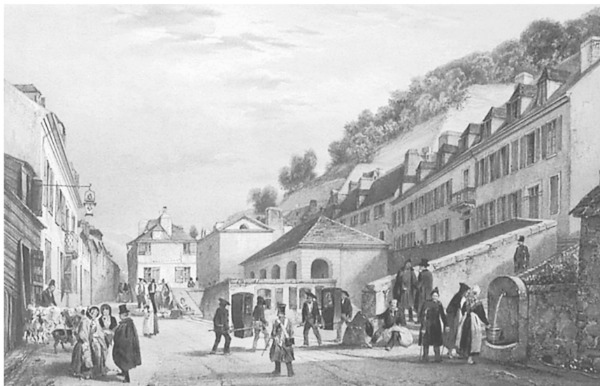
Fig. 3: Entrée de Barèges, 1834.

avalancheux avaient été installés au-dessus de la station, c'est du versant situé sur la rive droite du Bastan que descendirent ces avalanches dont la masse et le souffle, traversant le torrent, dévastèrent les habitations. Une vingtaine de bâtiments furent détruits, et 14 autres fortement endommagés, les maisons étant «bouleversées ou plutôt broyées par le choc et sous le poids de la neige» ou par «la pression de l'air». 25 Mais la répartition des dégâts dit néanmoins l'efficacité des dispositifs pare-avalanches, les bains et l'hospice n'étant que peu touchés par la catastrophe, les dégâts «provenant seulement de la chute directe de la neige». L'hospice est conservé «presqu'intact par sa seule position qui le met à l'abri de toute atteinte des avalanches» notait le capitaine Donnat.