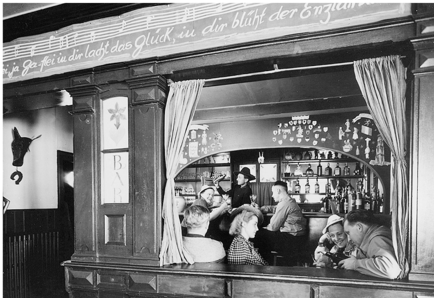
Abb. 6: Kurhaus Gaflei, Innenansicht: Bar, o. D. (um 1940). Liechtensteinisches Landesarchiv Gafli-116/1/113, Original in Privatbesitz.

des Volksbundes für das Deutschtum im Ausland und 1943 Ferienlager der Reichsdeutschen.