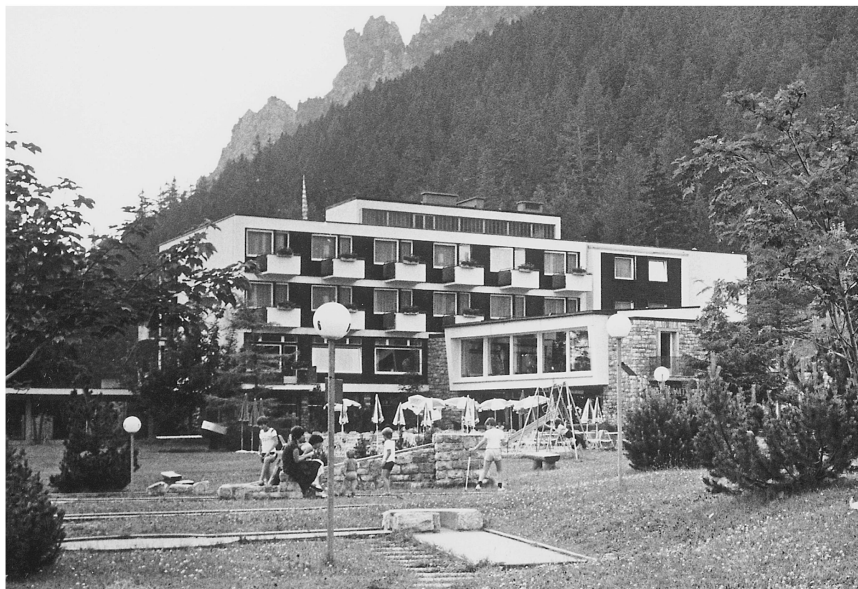
Abb. 4: Alphotel Gaflei, um 1983.