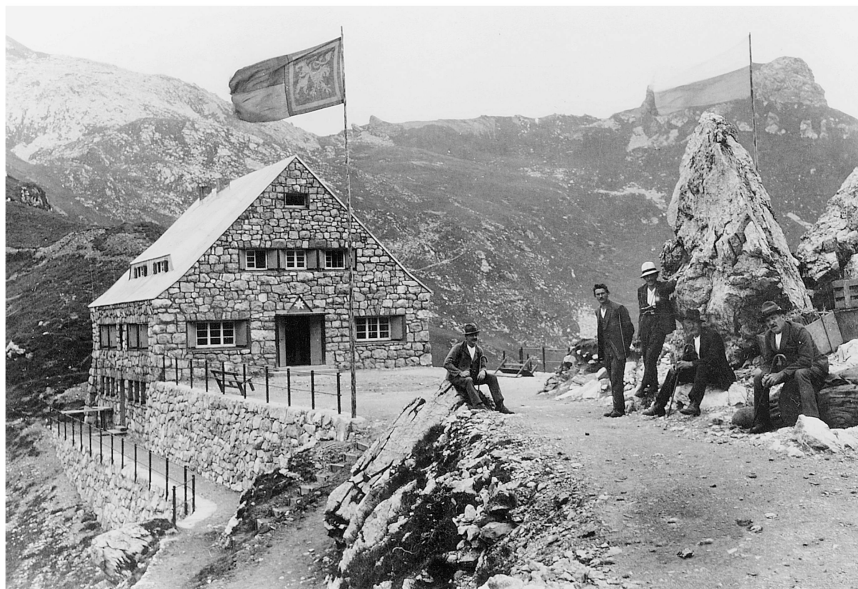
Abb. 2: Pfälzerhütte, um 1930, Liechtensteinisches Landesarchiv 132/1/19, Original in Privatbesitz.

mit Tischen, Stühlen, Betten, [...] in den verschiedensten Farben.» 4 Der Gastraum mit seinen getäfelten Wänden, einer Kastenbank entlang der Wand und einem Kachelofen fasste schon 1927/28 rund 60 Personen. Eine Anrichte trennt das Gastzimmer von der Küche mit Sitzecke und Speisekammer. Eine Bibliothek und ein Nebengastzimmer werden genannt. Im Dachgeschoss sind Schlafräume mit getäfelten Wänden und im Dachgiebel ein Notmatratzenlager sowie zwei Schlafräume untergebracht.