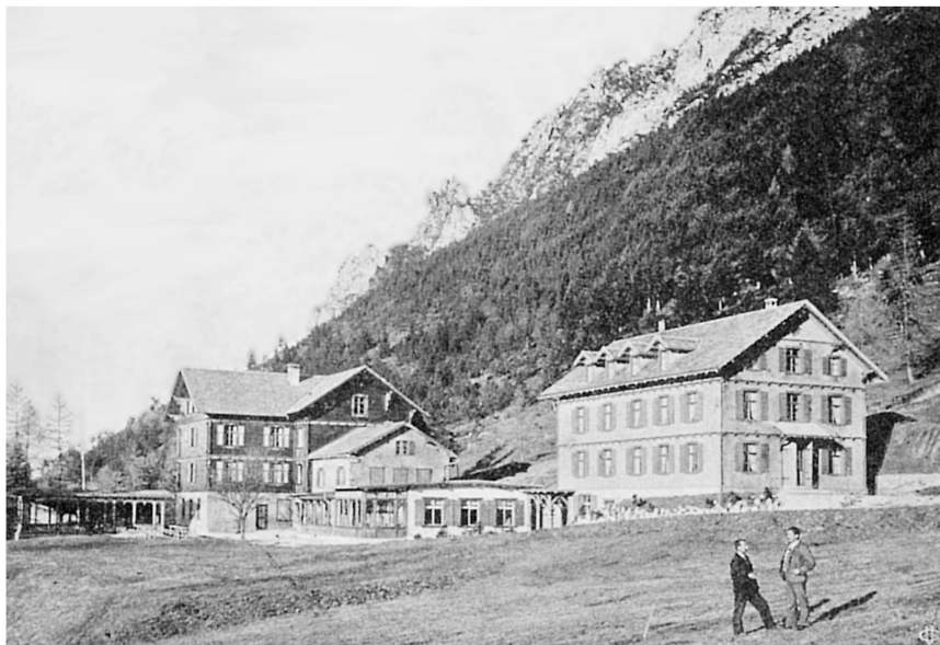
Abb. 5: «Kurhaus Gaflei ob. Vaduz, Fürstentum Liechtenstein». Postkarte um 1901.

Brettern» ersetzt werden. Grosser Saal, Wandelhalle und Veranda gehören zu den wichtigen Bauelementen des Kurhauses. 1901 wurden das neue «Waldhaus» und der so genannte Mittelbau vollendet. 37 In diesem Jahr, lange vor den Gemeinden im Tal, bekam das Kurhaus zudem elektrisches Licht für die Sommermonate. 38 Um die Jahrhundertwende nahm Gaflei den ersten Rang unter den Höhenkurorten ein.