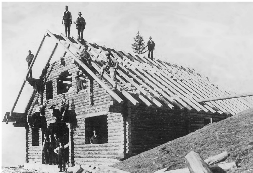
Abb. 3: Bau der Gafadurahütte, Richtfest um 1926. Liechtensteinisches Landesarchiv P-116/2/3, Original in Privatbesitz.

zimmer ist im Erdgeschoss anzunehmen. Der Zugang zur Mansarde erfolgte wie auch heute über ein zentrales Treppenhaus sowie rückseitig über eine einläufige Aussentreppe.