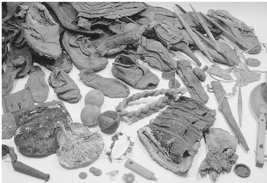
Abb. 1: Eine Auswahl der spätmittelalterlichen und frühneuzeitlichen Funde aus dem Mühlberg-Ensemble in Kempten (Allgäu): Zahlreiche komplett erhaltene Alltagsgegenstände fanden sich in den Hohlräumen eines Altstadthauses.

und die Besonderheit ihrer Lage innerhalb des Altstadt-kerns waren schon vor der im Herbst 1996 begonnenen Sanierung bekannt. Die Häuserzeile bildet den nördlichen Rand eines ehemals geschlossenen Bezirks rund um die 1426–1428 neu errichtete, gotische St.-Mang-Kirche 10 und war somit eine Nahtstelle zwischen kirchlichen und weltlichen Bereichen (Abb. 2, S. 157). Als Entstehungszeit der Gebäude hatte man aus baukundlichen Erwägungen bislang das 15. Jahrhundert angenommen. 11 Der älteste und wichtigste Strassenzug Kemptens, die in einem Teilstück heute noch so benannte Reichsstrasse, führte vom Flussübergang um den von der Stadt separierten Bezirk um St. Mang herum und öffnete sich schliesslich zum Marktplatz am Rathaus. Direkt südlich von Haus 12 vor dem Eingang der Kirche stand bis 1557 eine Gerichtslinde, unter der das so genannte Dorfgericht für die Grafschaft Kempten tagte, 12 daneben auf dem städtischen Friedhof die Michaels-Kapelle. 13 Abgaben an den klösterlichen Stadtherren (bis 1525) wurden zu