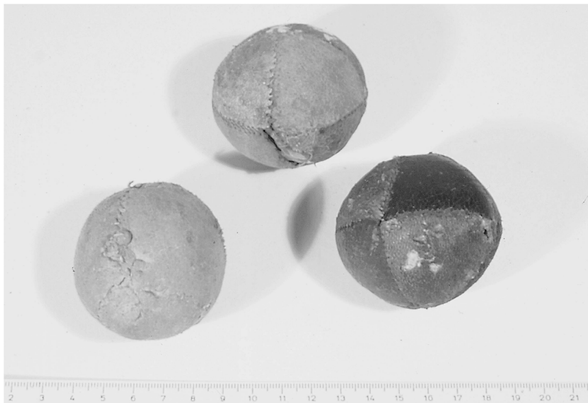
Abb. 3: Diese drei Bälle, die aus weichen, mehrfarbigen Lederstücken zusammenge­näht und mit Sägemehl ausgestopft sind, fanden sich ebenfalls im Fehlboden von Haus 8. Während zwei sehr sorgfältig und in ähnlicher Technik gefertigt sind, ist der dritte wohl zur Vervollständigung des Dreiersatzes eher grob nachgearbeitet worden.

Bestimmte Dinge weisen eine Multifunktionalität auf, die bei der Interpretation stets zu bedenken ist. Ein gutes Beispiel dafür sind kleinformatige, genähte Lederbälle; in Haus 8 fand sich ein Dreiersatz davon (Abb. 3), zwei identisch in der Machart, einer anscheinend nachgearbeitet. 24 Hält man sie zuerst eindeutig für Jonglierbälle als Spielgerät oder Artistenwerkzeug, so tun sich bei näherer Beschäftigung mit historischen Abbildungen oder der Sekundärliteratur eine Fülle weiterer Verwendungsmöglichkeiten auf: etwa als Loskugel oder als Abstimmungsball (Funde in Rathäusern zeugen davon) oder sogar als Einsatzzeichen beim Chorgesang (auch in Kirchen fanden sich solche Bälle mehrfach). 25