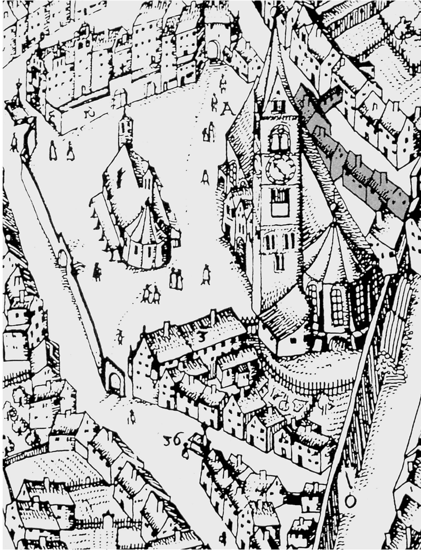
Abb. 2: Ausschnitt aus dem Stadtstich von Johann Hain und Friedrich Raidel von 1628. Die Mühlberg-Häuser sind grau markiert. Nach dem Steg zur gegenüberliegenden Häuserzeile bekam das Steinhaus (St.-Mang-Platz 12) den Beinamen «Seelhaus zum Steg». Das vierte Haus in der Reihe fiel dem Eisgang von 1670 zum Opfer und wurde nicht wieder aufgebaut.