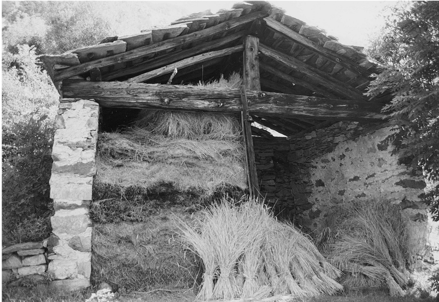
Ill. 4: Echallogne. «Dzerbi», dépendance céréalière pour le séchage des javelles. Dans cette partie de la région, les aires de battage sont externes.

gens et des bêtes y était permanente jusqu'au XXe siècle. Le second corps de bâtiment est en pierre. C'est une petite maison-tour 16 avec foyer et réserves. Les restrictions imposées sur l'usage des bois, mais surtout sa pénurie à cause de la présence de mines de fer, provoquent l'emploi parcimonieux de ce matériau, mais sans changement de modèle (Ill. 5-6).