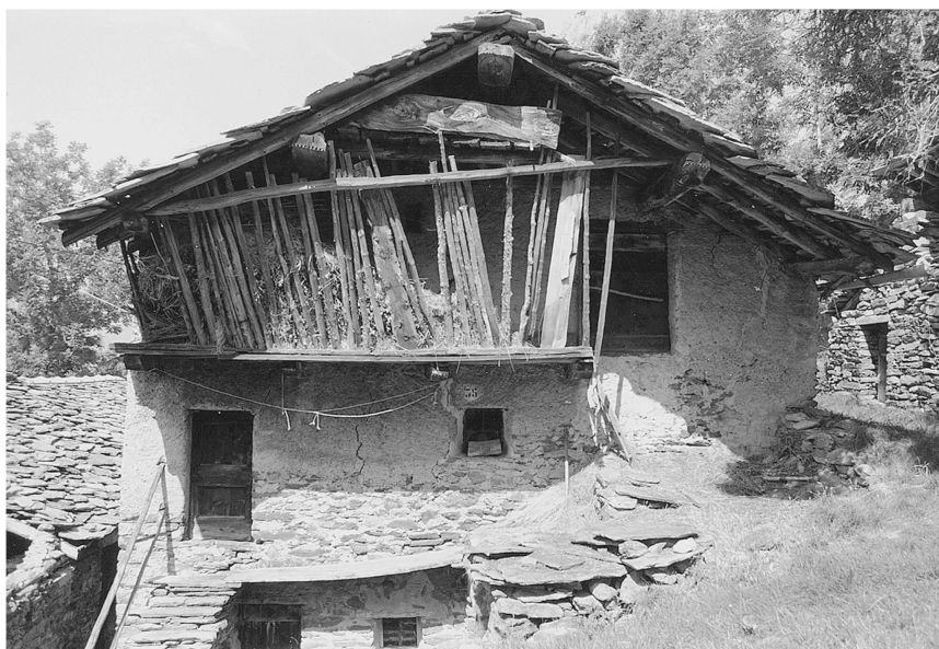
Ill. 3: Echallogne. Maison-bloc en hauteur de la seconde moitié du XIXe siècle. De bas en haut: étable, logis, fenil. Distribution entre les différents étages par l'extérieur.

pièces voisines n'ont pas évolué. L'abandon et la ruine, conséquences de la déprise rurale et des blocages fonciers ne sont pas une nouveauté. Quelle que soit l'époque, des possesseurs entreprenants, 12 éleveurs, commerçants, notables, émigrants saisonniers, transforment ou éliminent les bâtiments anciens au profit de constructions «modernes», symboles d'aisance économique ou d'un statut social différent, et/ou pratiquent le «gel foncier» en accumulant des patrimoines sans les transformer. Il est très rare en Vallée d'Aoste que l'ensemble des constructions d'un village suive une conjoncture de renouveau total, excepté naturellement en cas de catastrophe naturelle ou d'incendie.