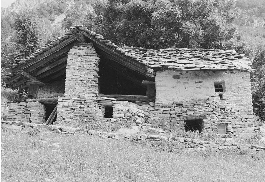
III. 2: Echallogne. À gauche, dépendance céréalière pour le séchage des javelles. Observer les supports récupérés d'un «raccard» préexistant.

logiques absolus et sûrs pour des bâtiments antérieurs au XVI e siècle, que ce soit pour les techniques de construction en bois ou pour celles des bâtiments en pierre avec pièces de bois en place. 9 En outre, dans deux cas, 10 les sondages effectués sur des solives de remploi ont montré que ces éléments avaient été travaillés au XI e siècle, avant les premières mentions écrites signalant l'existence des villages.