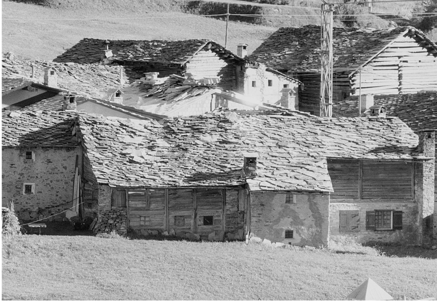
Ill. 5: Valnontey (Cogne). À l'avant plan, grande maison pour deux familles. Ruraux à cohabitation en bois et petits volumes en pierre, les péra, avec cave, foyer et chambre à provisions superposés.

le logis est à l'étage, pris entre l'étable et les réserves de foin (Ill. 3). Pour passer d'un étage à l'autre, on profite de la pente du terrain. Les escaliers intérieurs sont rares, excepté dans les maisons des notables.