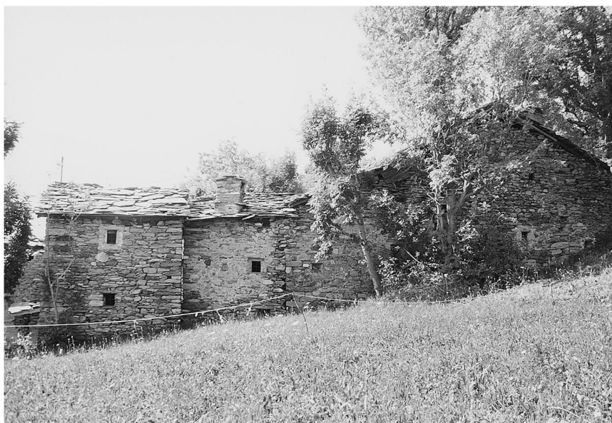
Ill. 1: Echallogne (Arnad). Adret de la basse vallée centrale. Un exemple d'ensemble complexe. Les maçonneries non enduites permettent une «lecture» des phases de construction.