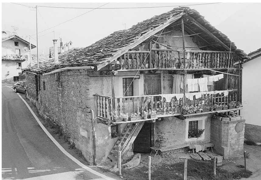
Ill. 8: Lignod (Ayas). Maison en pierre construite sur une parcelle dont le module est celui d'un raccard.