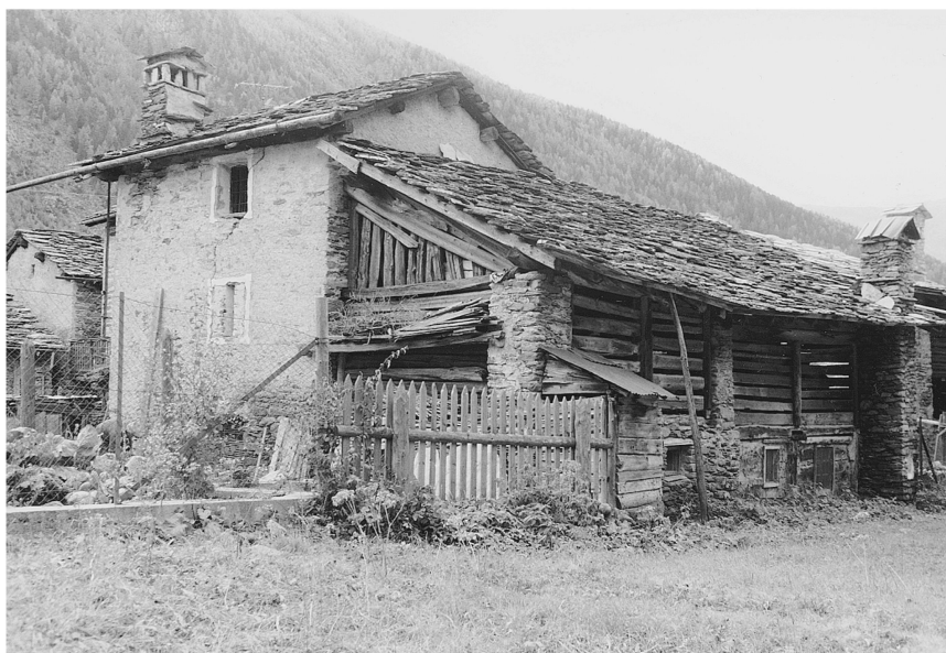
III. 6: Lillaz (Cogne). Les deux corps du modèle de maison, adopté par la population locale, se distinguent nettement. Noter l'usage parcimonieux du bois, comparé à la mise en œuvre des madriers ou des troncs à Valnontey.

Vers 1560, ce modèle a supplanté de nombreux raccards. Il s'est adapté à l'assiette foncière préétablie ou bien il a simplement fait table rase des bâtiments antérieurs. Ces ouvrages, encore nombreux aujourd'hui, témoignent qu'il existe à cette époque dans la Seigneurie de Challant des propriétaires fonciers cossus, mais ils démontrent surtout la présence sur place de maîtres-maçons et de tailleurs de pierre d'un très haut niveau. S'agit-il d'une main d'œuvre locale ou de migrants saisonniers? Ces éventuels migrants proviennent-ils d'Issime, du Biellais ou d'ailleurs?