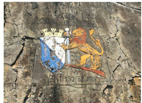
Abb. 3 – Wappen.