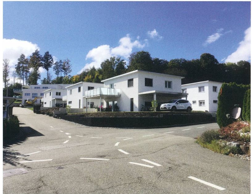
Abb. 1 – Im Gebiet Rinderrüti/Spitzenrüti entstand ein neues Quartier.

dem oder gerade deswegen verursacht er gegenwärtig grosse Kosten, da die Überdeckung des Bachlaufes in einem sehr schlechten Zustand ist. Im Bereich Bachstrasse/Bahnhofstrasse nördlich der Fussgängerunterführung «Schnägg» wurde die Überdeckung deshalb bereits erneuert. Auch im Dorfzentrum, vom Mehrzweckplatz (COOP) bis zum Einlenker in Kirchrain und Bachstrasse, muss die Eindolung erneuert und aus Gründen des Hochwasserschutzes teilweise das Bachprofil erweitert werden. Die Bauarbeiten dürften im November 2021 abgeschlossen sein. Danach bleiben wenige bauliche