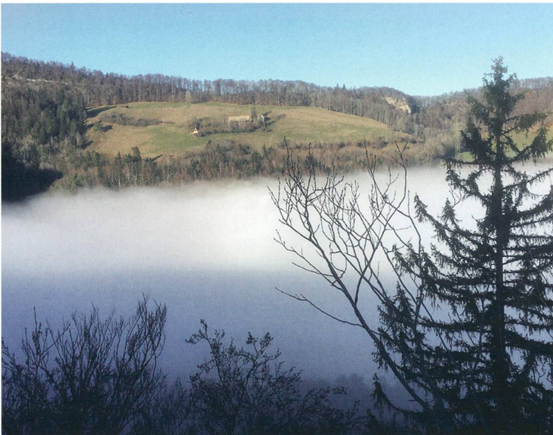
Abb. 2 – Blick vom Allerheiligenberg auf den 911 Meter über Meereshöhe gelegenen Sonnenberg.

Die Gwidem-Kinder besuchten die Schule in Langenbruck, zur Kirche ging man jedoch nach Högendorf. Das gleiche galt für die nahe von Bärenwil gelegenen Höfe Rütteli, Buchmatt und Asp.