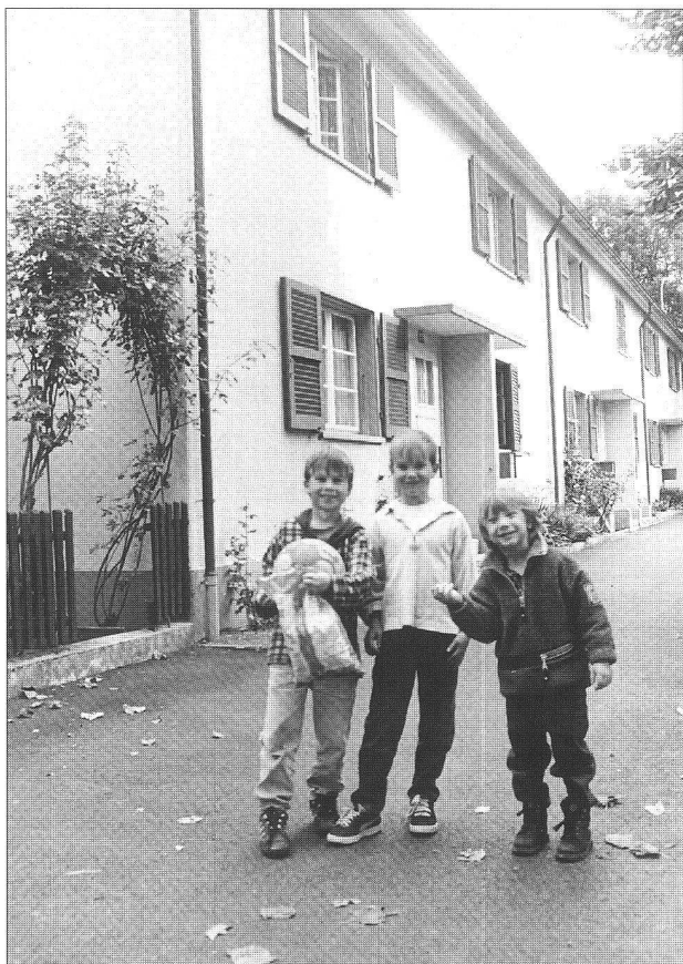
Le décor planté par Eduard Lanz au début des années 20 a bien résisté.