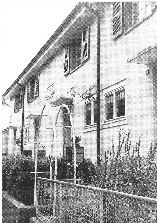
Cette construction de cité-jardin remonte au début des années 30, toujours sous la signature d'Eduard Lanz.

contentés de gérer, rénover, entretenir un parc de petits logements plutôt bon marché, entre 650 et 750 fr le trois-pièces.