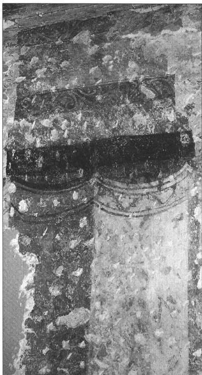
Détail des peintures découvertes au 1 er étage de la rue Cité-Derrière N° 28 dans une pièce située sur la partie nord de l'immeuble. A droite, détail d'une autre peinture découverte dans le même site.

«Il est primordial d'anticiper l'évolution du loyer dans le temps. A Cité-Derrière, par exemple, l'appartement sera loué 700 francs dans une première phase, et 1200 francs dans dix ans. Il serait judicieux de créer une provision pour échelonner l'augmen-