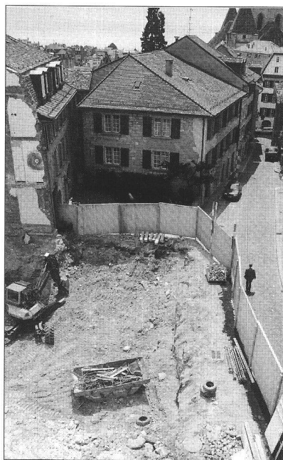
Vue des travaux de terrassement sur l'emplacement de la rue Cité-d'arrière N° 20. Ci-dessous, vue panoramique et «anticipative».

Malgré cette situation encore sombre, Philippe Diesbach estime que la