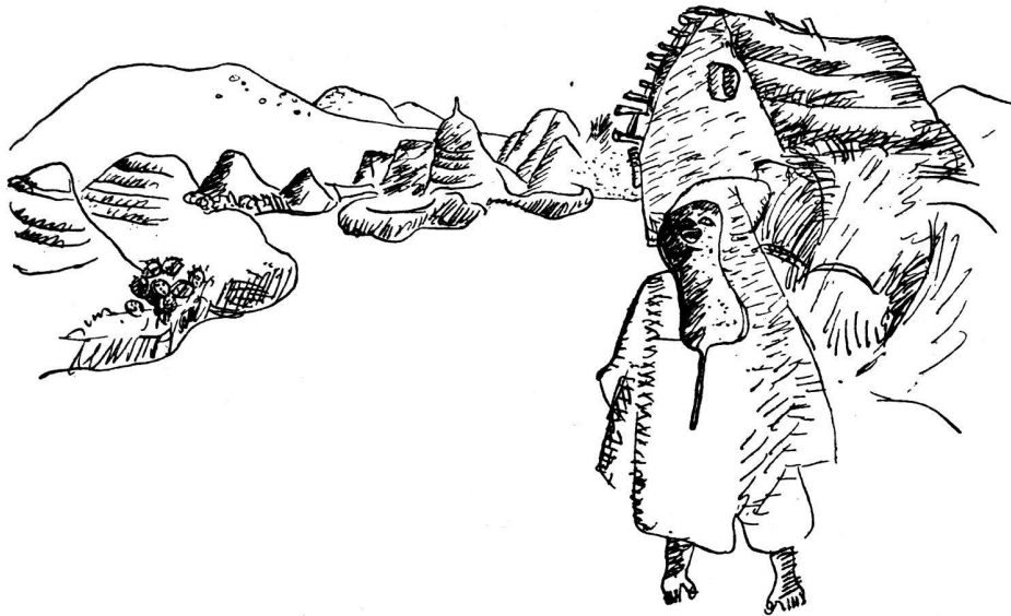
Dans le Rif