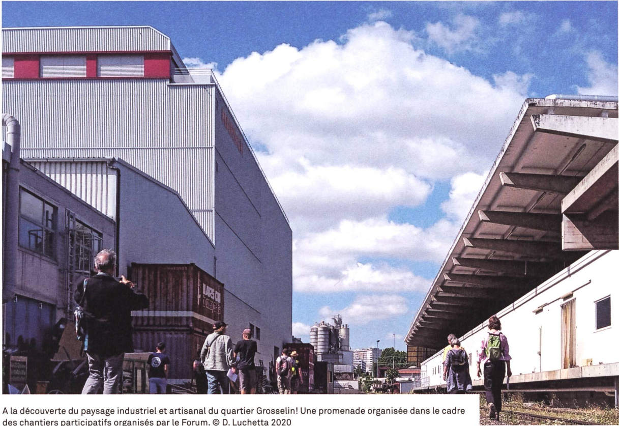
A la découverte du paysage industriel et artisanal du quartier Gosselin! Une promenade organisée dans le cadre des chantiers participatifs organisés par le Forum.

s'émancipe et se pérennise. Régulièrement, se réunissent un grand nombre de citoyen-ne-s, d'expert-e-s, de spécialistes et de passionné-e-s de la fabrique de la ville depuis le premier «Forum ouvert» de cette même année.