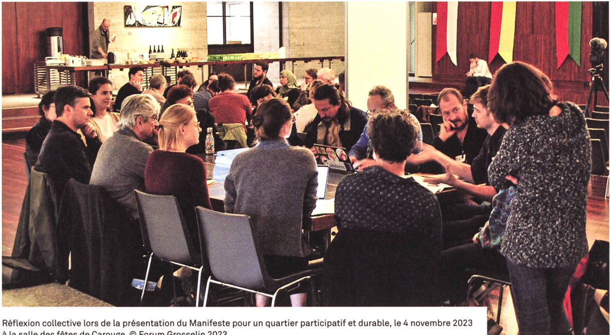
Réflexion collective lors de la présentation du Manifeste pour un quartier participatif et durable, le 4 novembre 2023 à la salle des fêtes de Carouge.

Le Forum Grosselin, avec la participation du consortium de coopératives d'habitation «Grosselin demain» 1 , a présenté publiquement le 4 novembre 2023 un «Manifeste citoyen pour un quartier participatif et durable», une vision porteuse pour ce quartier dans le périmètre Praille Acacias Vernets (PAV).