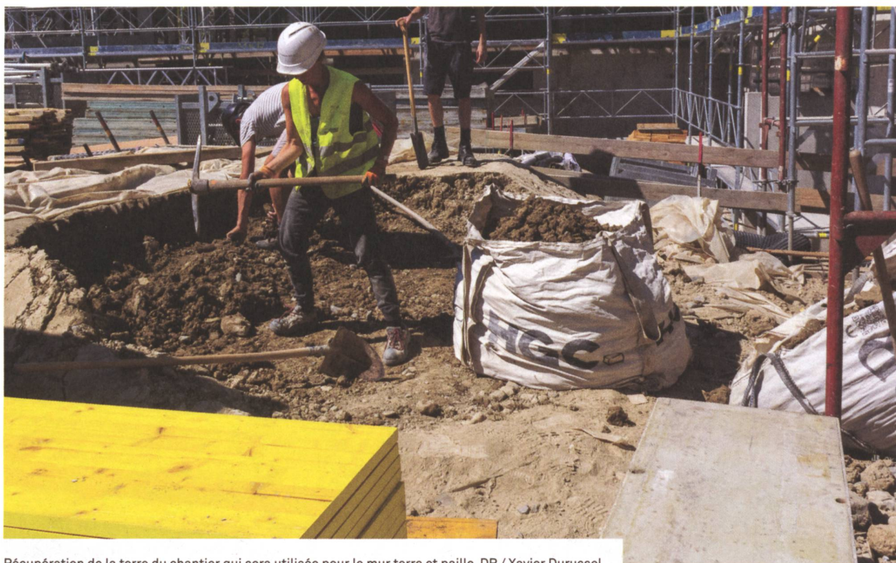
Récupération de la terre du chantier qui sera utilisée pour le mur terre et paille.

des associées est aussi coopératrice d'Ecopolis. Une fenêtre de cette expérience est conservée au rez-de-chaussée et montre les différentes couches de la construction. Le second chantier, d'une tout autre nature, a consisté à huiler le bois de toutes les cuisines et armoires intégrées. Un chantier conséquent avec énormément de travail qui a permis au groupe de se former et de se souder.