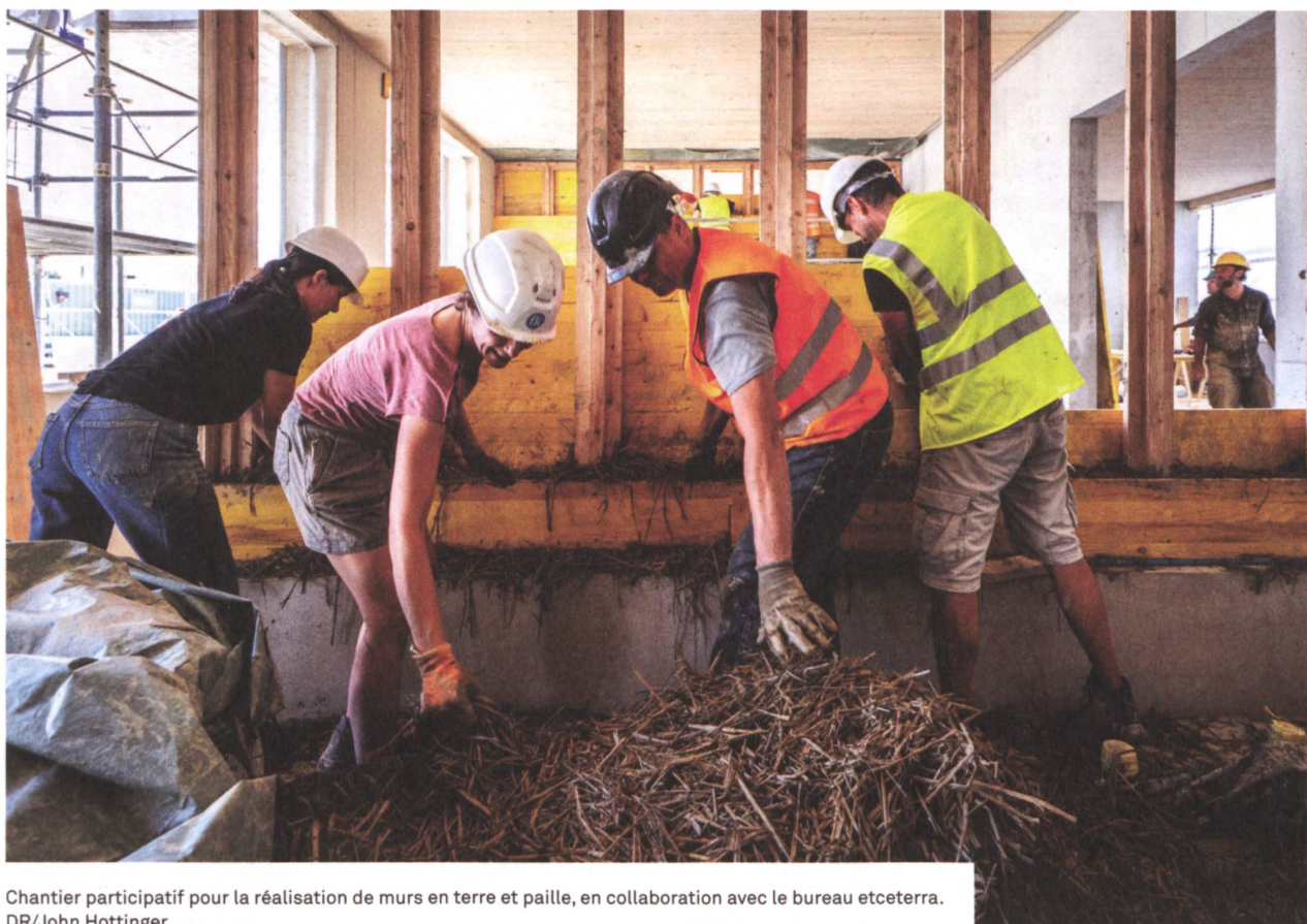
Chantier participatif pour la réalisation de murs en terre et paille, en collaboration avec le bureau etceterra.