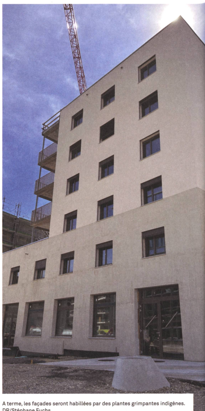
A terme, les façades seront habillées par des plantes grimpantes indigènes.