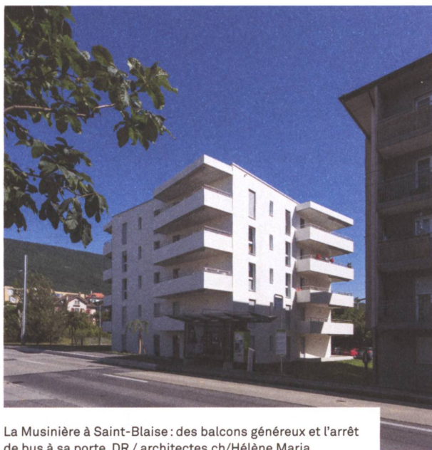
La Musinière à Saint-Blaise : des balcons généreux et l'arrêt de bus à sa porte.