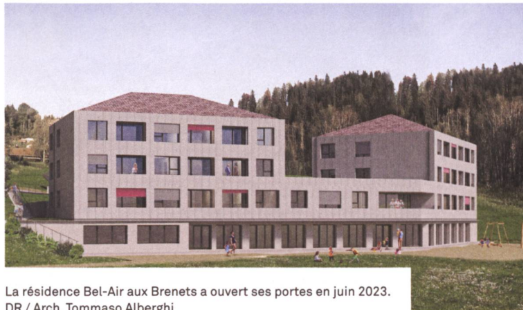
La résidence Bel-Air aux Brenets a ouvert ses portes en juin 2023. DR / Arch. Tommaso Alberghi

La Coopérative Arc-en-ciel a à son actif plusieurs immeubles comprenant à ce jour un total de 89 logements. Son premier bâtiment a été achevé en septembre 2015 à Fontainemelon dans le Val-de-Ruz. Il est doté de 27 logements à prix coûtant. Dans un souci de flexibilité des espaces, les 2 pièces sont combinables avec les 3 et 4 pièces, de manière à rendre possible une cohabitation entre des familles et un aîeul ou une personne en situation de handicap, qui garderait son autonomie, sans pour autant être isolée. Le bâtiment est raccordé