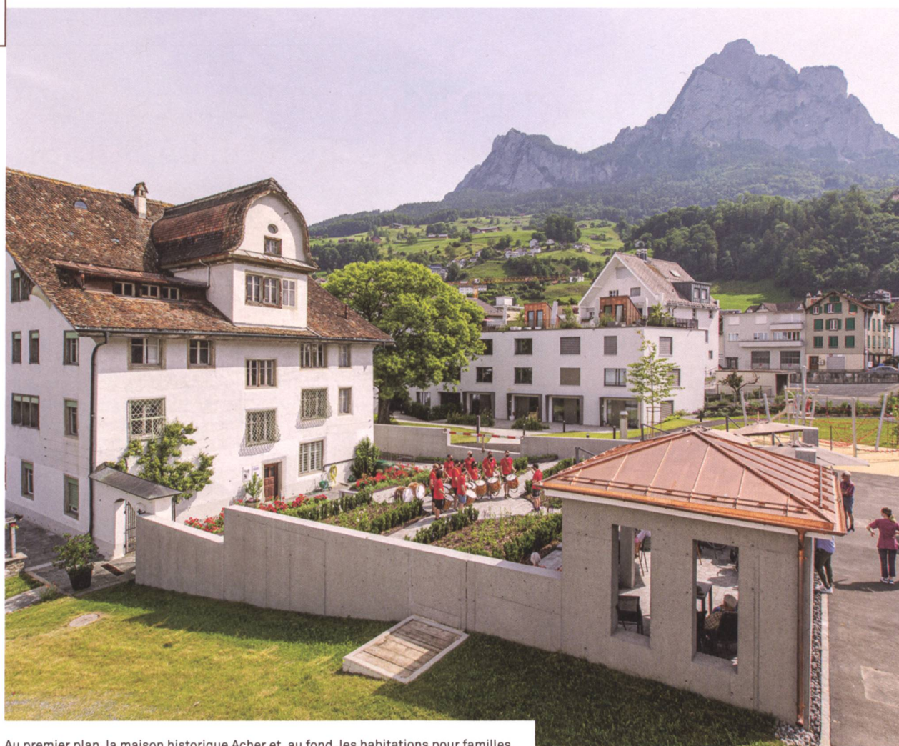
Au premier plan, la maison historique Acher et, au fond, les habitations pour familles.

site alors une rénovation d'envergure et un agrandissement vient compléter l'offre pour les seniors indépendants. Afin de gérer ce riche complexe, et en premier lieu le centre pour les troisième et quatrième âges, la fondation ecclésiastique est transformée en 2014 en une fondation classique d'utilité publique appelée «Stiftung Acherhof», à but non lucratif. Dans ses actes de fondation, elle s'est fixé les principes suivants: offrir à chacun des services et un accompagnement pour «le corps, l'esprit et l'âme», de manière à aider, dans la vie de tous les jours, à supporter la maladie et le vieillissement et de «pouvoir aborder la mort de manière sereine».