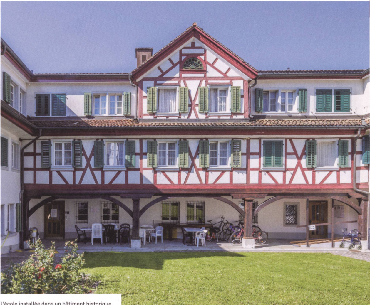
L'école installée dans un bâtiment historique.

contre à chaque étage ou à l'extérieur sur la place de jeux ou dans le parc.