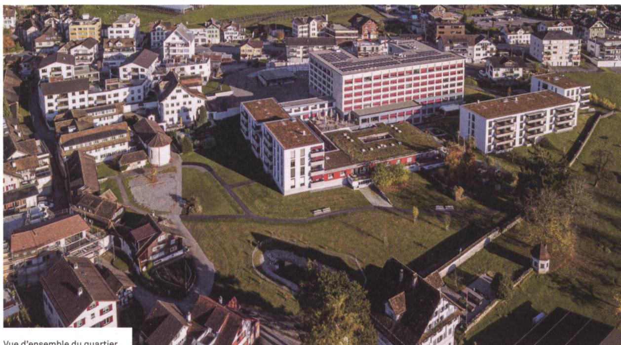
Vue d'ensemble du quartier

C'est en 1931 déjà qu'est inauguré l'établissement médico-social Acherhof dans un bâtiment historique du centre de la commune, proche du couvent des Dominicaines St. Peter. Quarante ans plus tard, un nouveau bâtiment plus grand et mieux adapté est construit à l'emplacement actuel. Puis, en 2008, la maison François est aménagée pour les personnes souffrant de démence. En 2019, le bâtiment principal néces-