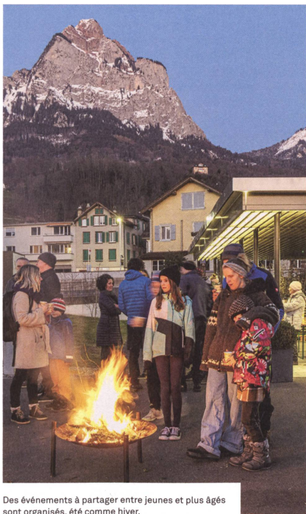
Des événements à partager entre jeunes et plus âgés sont organisés, été comme hiver.

d'assurer les infrastructures adéquates, tout en offrant des services selon les besoins et envies des habitants. La situation centrale du quartier est idéale, proche du cœur historique, des transports publics, de l'hôpital, des magasins.