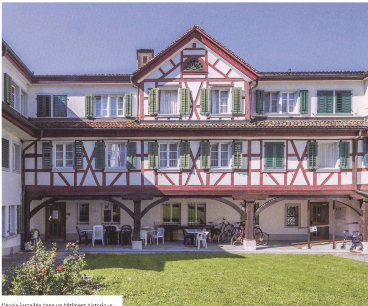
L'école installée dans un bâtiment historique.

contre à chaque étage ou à l'extérieur sur la place de jeux ou dans le parc.