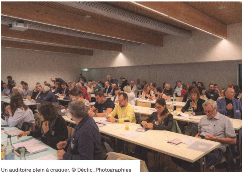
Un auditoire plein à craquer.

La population vieillissante de Suisse pose un véritable défi en matière de politique du logement. Pour tenter d'y voir clair et oser quelques pistes pour y remédier, l'ARMOUP a invité à la réflexion et à la prospective lors d'une journée riche en échanges et en découvertes.