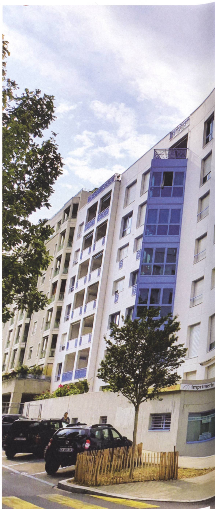
Façades rénovées de deux immeubles de la coopérative Le Jet d'Eau à Genève.

Entre les intentions politiques – et les nôtres – et la concrétisation, c'est très compliqué. Je comprends évidemment ce besoin d'assainir le parc immobilier, mais les démarches pour solliciter les aides et obtenir les subventions sont vraiment complexes. Il y a beaucoup de formulaires à remplir, de documents à présenter, dont certains datent de l'année de construction du bâtiment (la coopérative Jet d'Eau a été fondée en 1976, ndr). Un soutien technique de qualité serait essentiel pour les petites coopératives comme les nôtres. Et bien entendu, le fait de devoir investir pour les rénovations avant de toucher les aides peut être problématique. Mais je dois dire que nous avons la chance de mener les travaux avec des entreprises et des professionnels compétents et aidants, ce qui nous soulage. JL