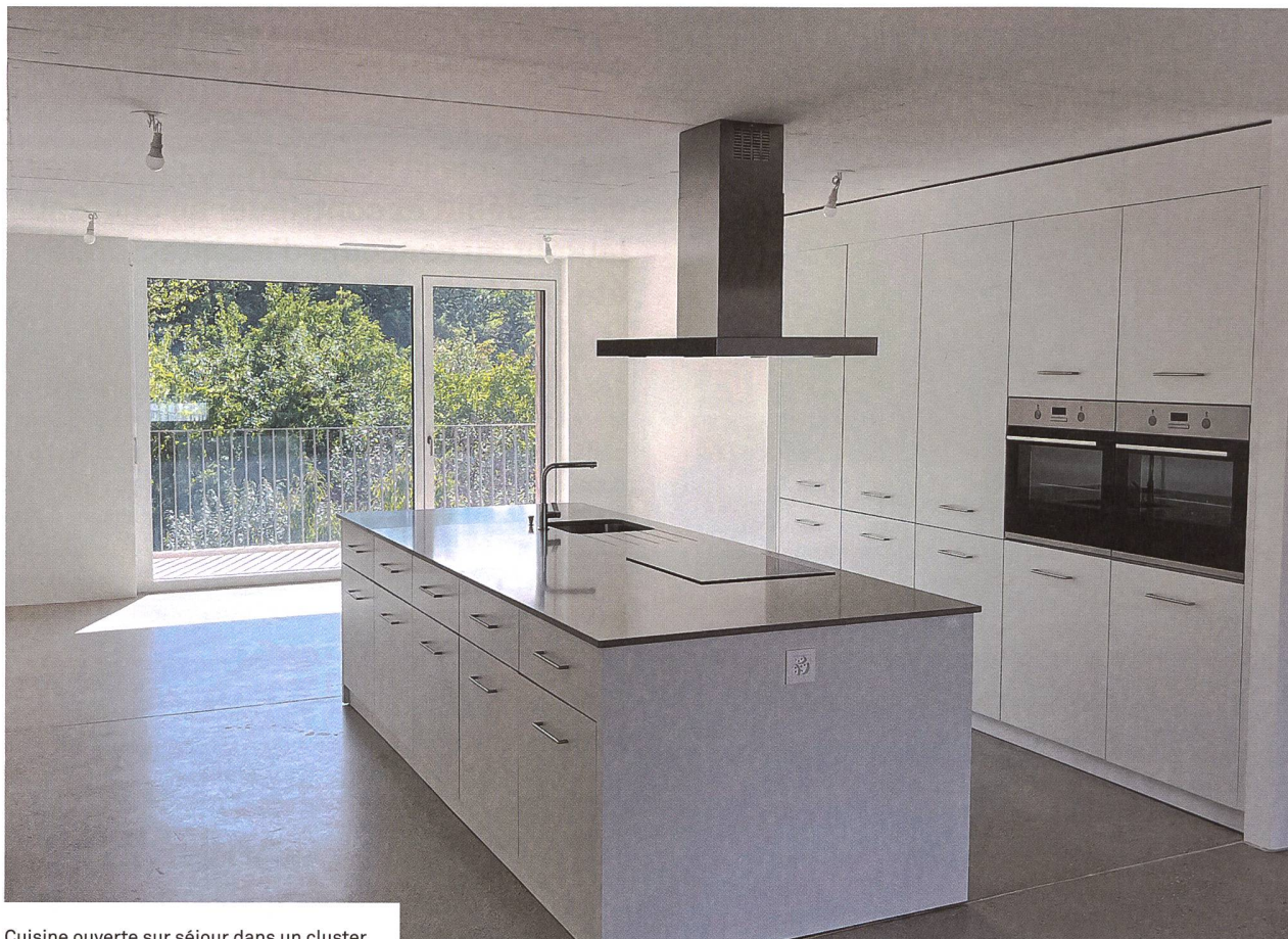
Cuisine ouverte sur séjour dans un cluster.

La Codha invite les futurs habitant-e-s à participer très tôt à l'élaboration d'un projet d'habitation, dans une triangulation entre les architectes qui soumettent les propositions architecturales, les collaborateurs de la Codha qui déterminent les cadres financiers et légaux et les groupes de futurs habitant-e-s qui apportent leurs propres propositions et qui se positionnent par rapport à celles des architectes et des collaborateurs de la Codha. Une mécanique bien réglée par une charte participative (de plusieurs pages), qui définit les différentes étapes de la réalisation d'un projet et qui est signée par toutes les parties. «Et puis il y a les imprévus... c'est la partie que l'on préfère à la Codha, parce que c'est parfois là qu'émergent les solutions les plus innovantes!», s'exclame Guillaume Käser, qui rappelle qu'un projet de la Codha n'est jamais figé dans le marbre dès le départ. Un projet, ça vit, ça évolue, ça s'enrichit au cours du processus participatif. «Collaborer avec un maître d'ouvrage ouvert d'esprit et novateur, tel que la coopérative la Codha, qui réunit des habitants souhaitant habiter autrement, constitue une chance unique pour un bureau d'architectes», soulignent les architectes.