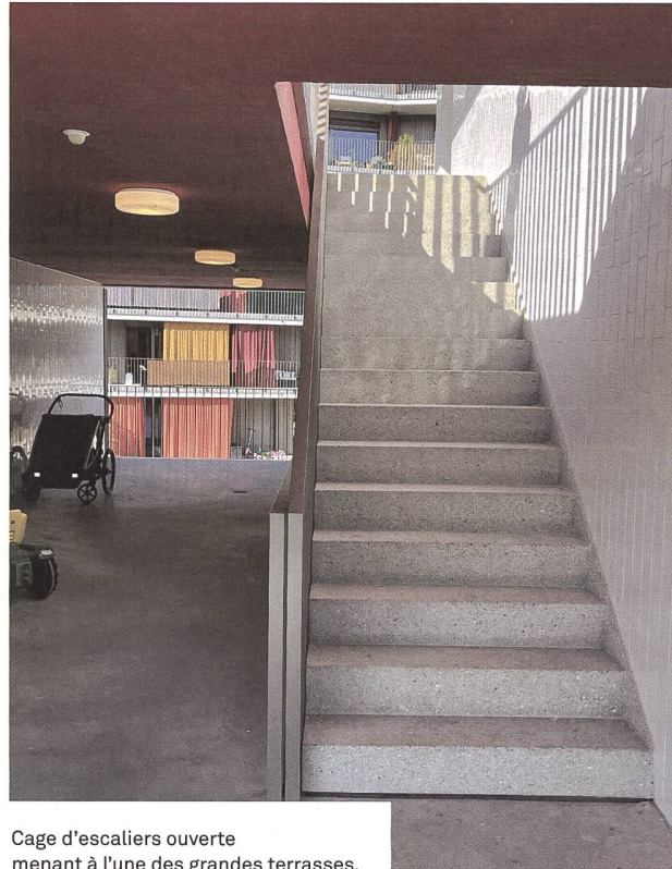
Cage d'escaliers ouverte menant à l'une des grandes terrasses.

Et c'est tant mieux, parce que la demande pour le genre d'habitats développés par la Codha est très forte, comme en témoignent les 5000 membres que compte la coopérative, dont seulement 900 sont logés à ce jour. Entre 700-800 privilégiés, en tête de la liste d'attente, trouveront bientôt leur bonheur dans les projets en cours de développement 2 . Il n'est d'ailleurs pas rare de voir la coopérative gagner des prix d'architecture, les derniers en date précisément pour l'écoquartier du Stand, décernés par le Prix Bilan de l'Immobilier 2022, et où la Codha a remporté pour l'écoquartier du Stand le 1 er prix dans la catégorie Logements d'utilité publique et le 3 e prix dans la catégorie Spécial durabilité et écologie du bâtiment... ou encore le 1 er prix dans la catégorie Des lieux et des liens