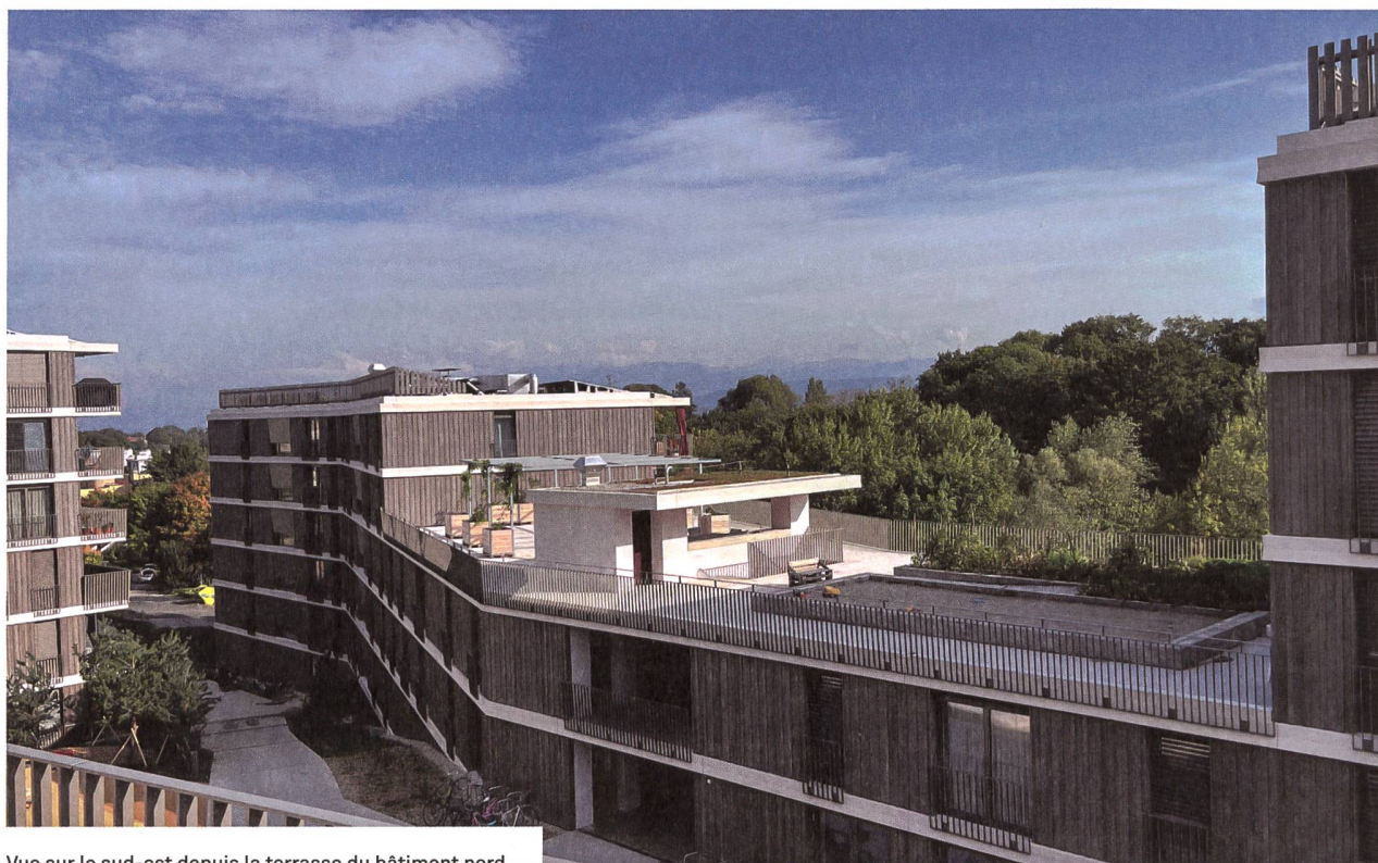
Vue sur le sud-est depuis la terrasse du bâtiment nord.