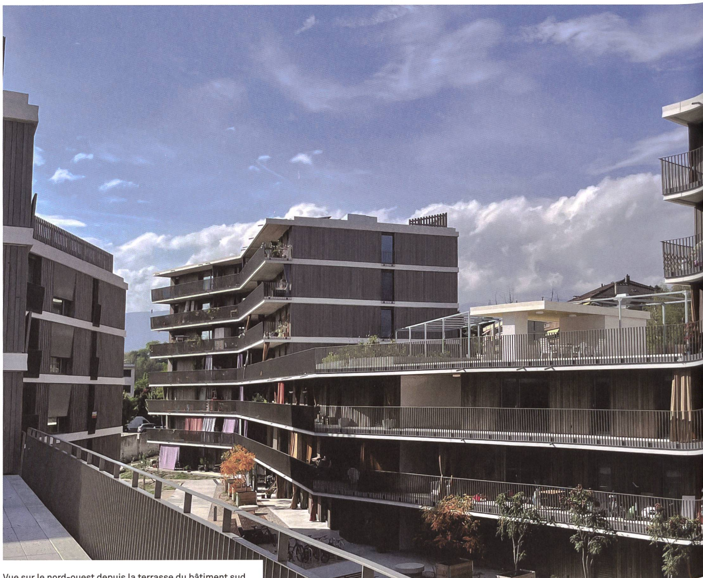
Vue sur le nord-ouest depuis la terrasse du bâtiment sud.

Les habitant·e·s ont emménagé cet été dans le splendide écoquartier du Stand à Nyon. La Codha se félicite d'un projet de longue haleine bien abouti... et qui récolte déjà un premier prix d'architecture, récompensant la qualité écologique et durable du lotissement.