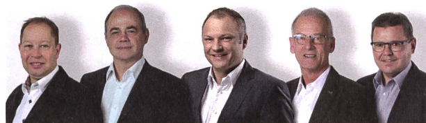
L'équipe terrain de GUTEX à disposition pour le conseil et la commercialisation d'isolant en fibres de bois. Contact: www.gutex.ch/kontakt

Les clients du traditionnel hôtel Cailler profitent désormais d'un climat ambiant encore plus sain et confortable pendant leurs vacances. Cette isolation écologique du toit en fibres de bois régionales profite également à l'environnement et au climat : Le stockage durable de carbone dans le matériau contribue, au-delà de ses propriétés isolantes, à agir positivement sur la teneur en CO 2 de l'atmosphère et à atteindre les objectifs nécessaires en matière de protection climatique. L'utilisation de matières premières renouvelables dans les bâtiments se révèle dès lors être une contribution décisive à la réduction des émissions de gaz à effet de serre. Pendant la phase de croissance des arbres, de grandes quantités de CO 2 sont prélevées dans l'atmosphère et durablement fixées dans les matériaux de construction à base de bois.