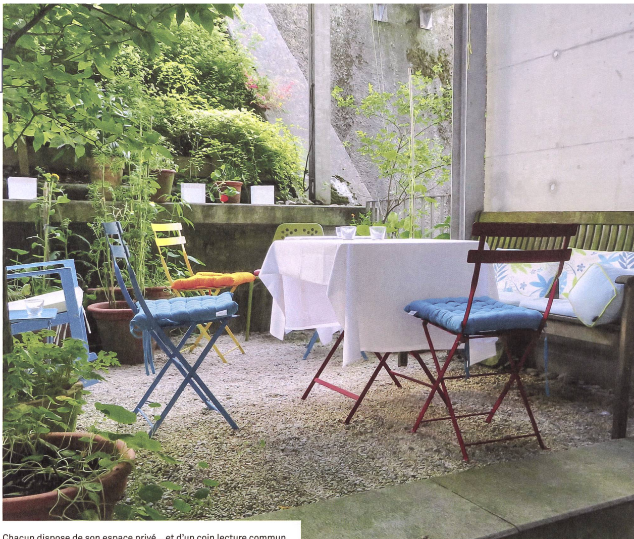
Chacun dispose de son espace privé... et d'un coin lecture commun