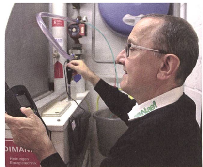
Le HAT-System est utilisé depuis 1999.

Le HAT-System est le seul procédé d'assainissement des conduites par l'intérieur garantissant l'étanchéité à l'oxygène conformément à la norme DIN 4726 des conduites en plastique équipant les chauffages au sol. Il arrête ainsi le vieillissement. De cette manière, le prolongement de la durée de vie des conduites est garanti. En parallèle, tous les autres composants essentiels du chauffage au sol sont entretenus ou remplacés. La désidérabilité de la version originale est mise en valeur par une garantie de 10 ans.