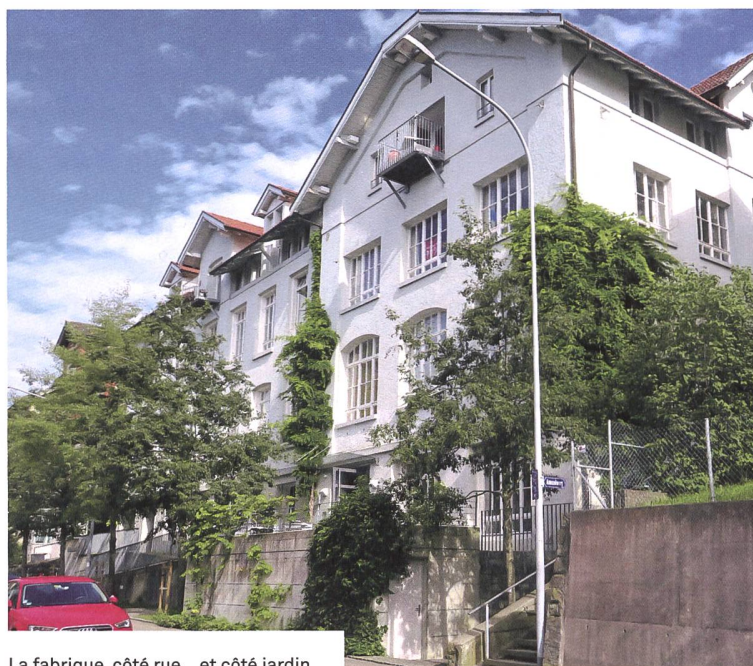
La fabrique, côté rue... et côté jardin.

Il y a un peu plus de vingt ans, un petit groupe de femmes engagées, dans la cinquantaine, réfléchit à comment vivre la deuxième partie de leur vie. Quitter la villa familiale à la campagne devenue trop grande pour se recentrer en ville, et combiner habitation individuelle et espaces partagés. Le nom de la coopérative créée à cet effet reflète cet état d'esprit: «solo» (seul) et «insieme» (ensemble). En 1999, la fabrique de textile de la Tschudistrasse était à vendre. Tout s'est ensuite enchaîné et au lieu des quatre à six appartements prévus, le projet s'est agrandi, alliant patrimoine industriel et modernité, mélangeant habilement sphère privée et publique. En 2002 tous les appartements avaient trouvé preneur.