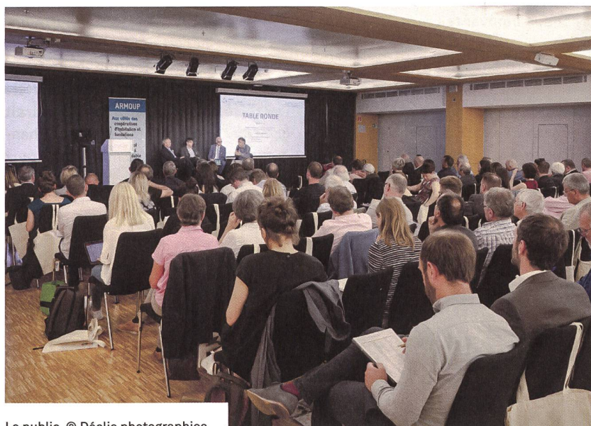
Le public.