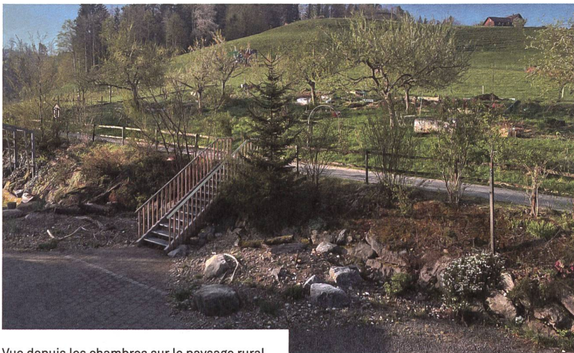
Vue depuis les chambres sur le paysage rural.

Pour en savoir plus: www.wogeno-mogelsberg.ch