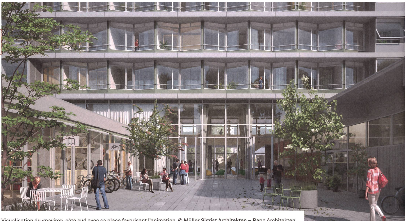
Visualisation du «navire», côté sud avec sa place favorisant l'animation. © Müller Sigrist Architekten – Rapp Architekten

et environnemental dans la ville et ses quartiers. Elle promeut notamment des logements attractifs, abordables pour tous, favorise la mixité sociale par l'intégration de populations de provenance et d'âge diversifiés. Elle veut expérimenter de nouvelles formes d'habitat et de places de travail, et encourage une culture du bâti de qualité, dans un cadre de vie attractif.