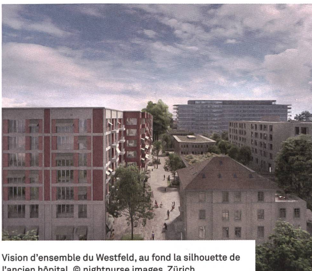
Vision d'ensemble du Westfeld, au fond la silhouette de l'ancien hôpital.

D'un point de vue énergétique, wohnen&mehr s'appuie sur les objectifs de la société à 2000 watts, notamment par des installations photovoltaïques. Elle recourt à des matériaux de construction respectueux de l'environnement, comme du béton recyclé partout où la statique le permet. La mobilité douce est encouragée, le quartier étant très bien relié aux transports publics et un réseau de services et de magasins de proximité se développe. Une grande importance est accordée aux aménagements extérieurs: une ceinture verte, des jardins avec jeux pour toutes les générations, des toitures et façades végétalisées, la plantation de nombreux arbres en font un quartier en pleine verdure, adapté à la lutte contre le réchauffement climatique et profitant aux habitants pour se ressourcer et se dépenser. Des projets pour favoriser la biodiversité, comme les martinets noirs et les abeilles, sont aussi prévus. D'un point de vue social, la variété de taille et de forme des logements, du studio au cluster de sept pièces et demi, en passant par des duplex, et des espaces communs, entend