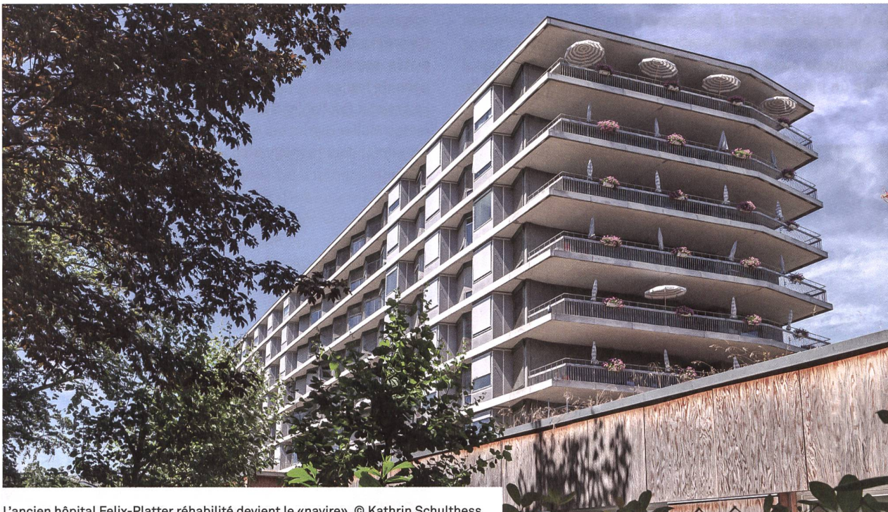
L'ancien hôpital Felix-Platter réhabilité devient le «navire».

Le classement de ce bâtiment emblématique fut une étape décisive qui ouvrait la voie pour la planification de 530 logements sur les 36 000 m 2 du site de l'hôpital Felix-Platter, rebaptisé Westfeld. La coopérative wohnen&mehr, fondée en 2015, se voit alors confier la gestion de l'ensemble. Elle s'engage pour la durabilité dans les domaines économique, social