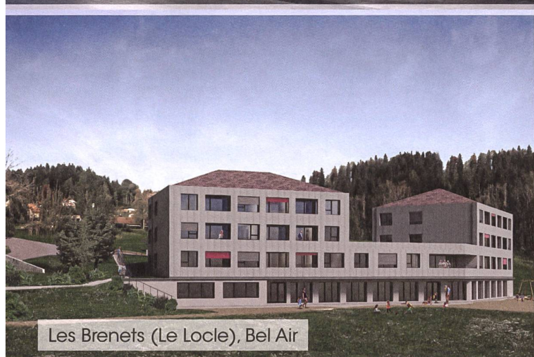
Les Brenets (Le Locle), Bel Air