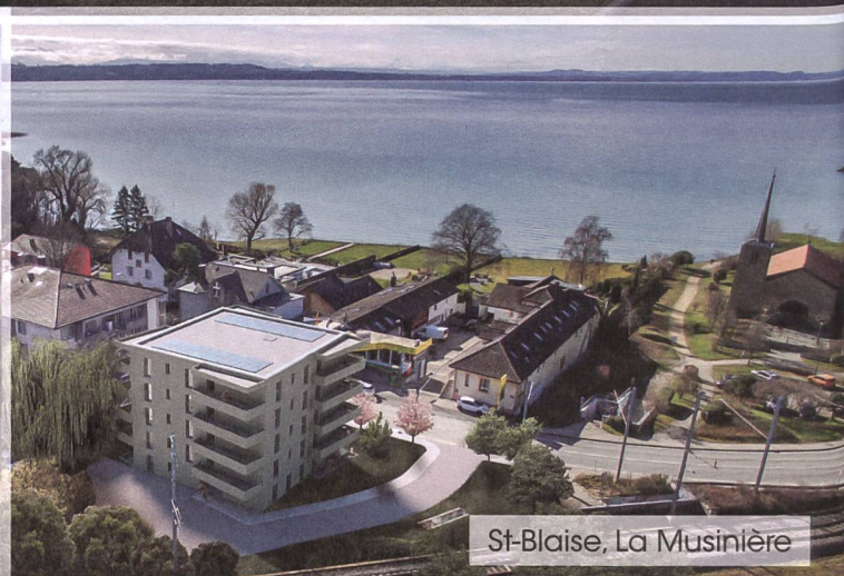
St-Blaise, La Musinière