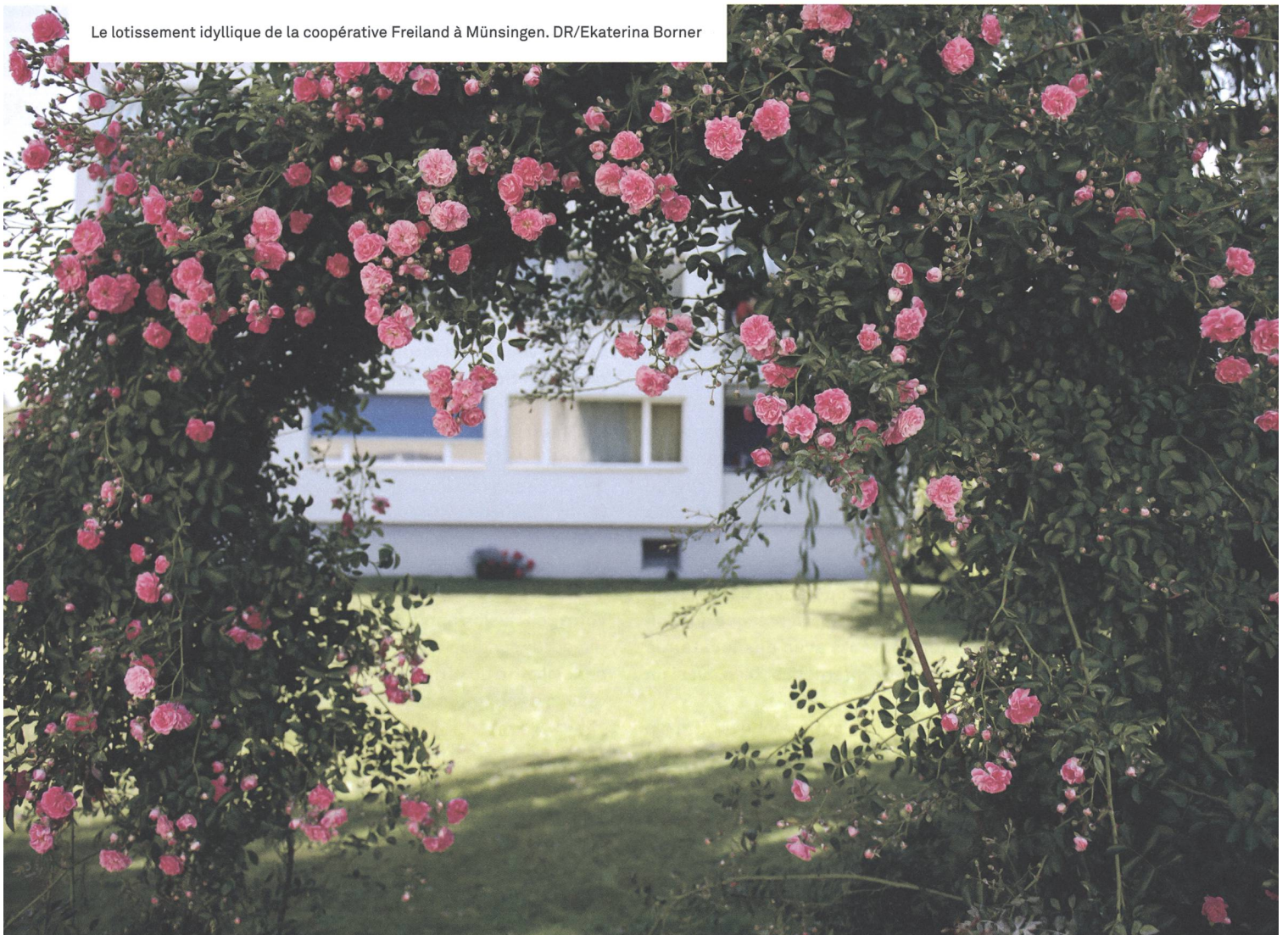
Le lotissement idyllique de la coopérative Freiland à Münsingen.

Un outil de gestion du parc immobilier avec administration des loyers, calcul des coûts par lotissement etc. est absolument indispensable. Pour gérer les chantiers, il faut également se doter d'un logiciel courant – et d'une personne qui le maîtrise au sein du conseil d'administration! Trello est une app qui s'est révélé être un excellent outil de coopération au sein du conseil administratif. Cet outil est notre base de données commune et fournit à tout moment une vue d'ensemble transparente et actualisée de toutes les affaires, rendez-vous et tâches en cours. Les mots-clés facilitent grandement la recherche de documents ou autres données utiles.