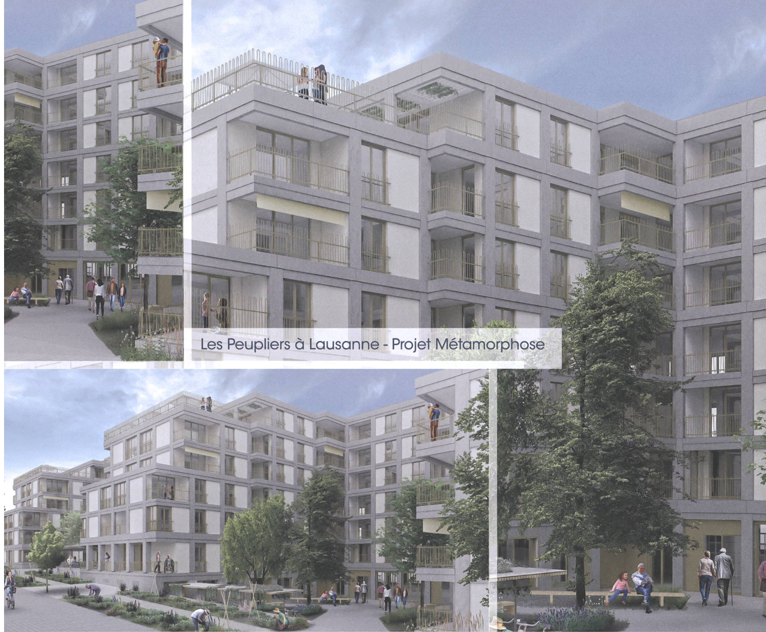
Les Peupliers à Lausanne - Projet Métamorphose

coopérative d'utilité publique cité derrière