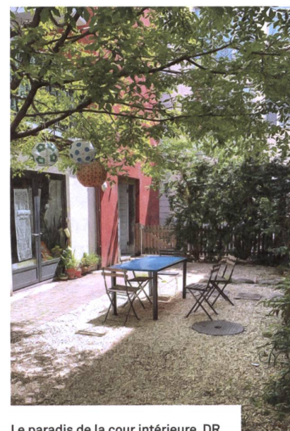
Le paradis de la cour intérieure.