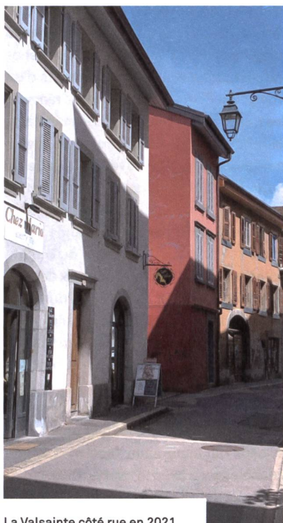
La Valsainte côté rue en 2021...