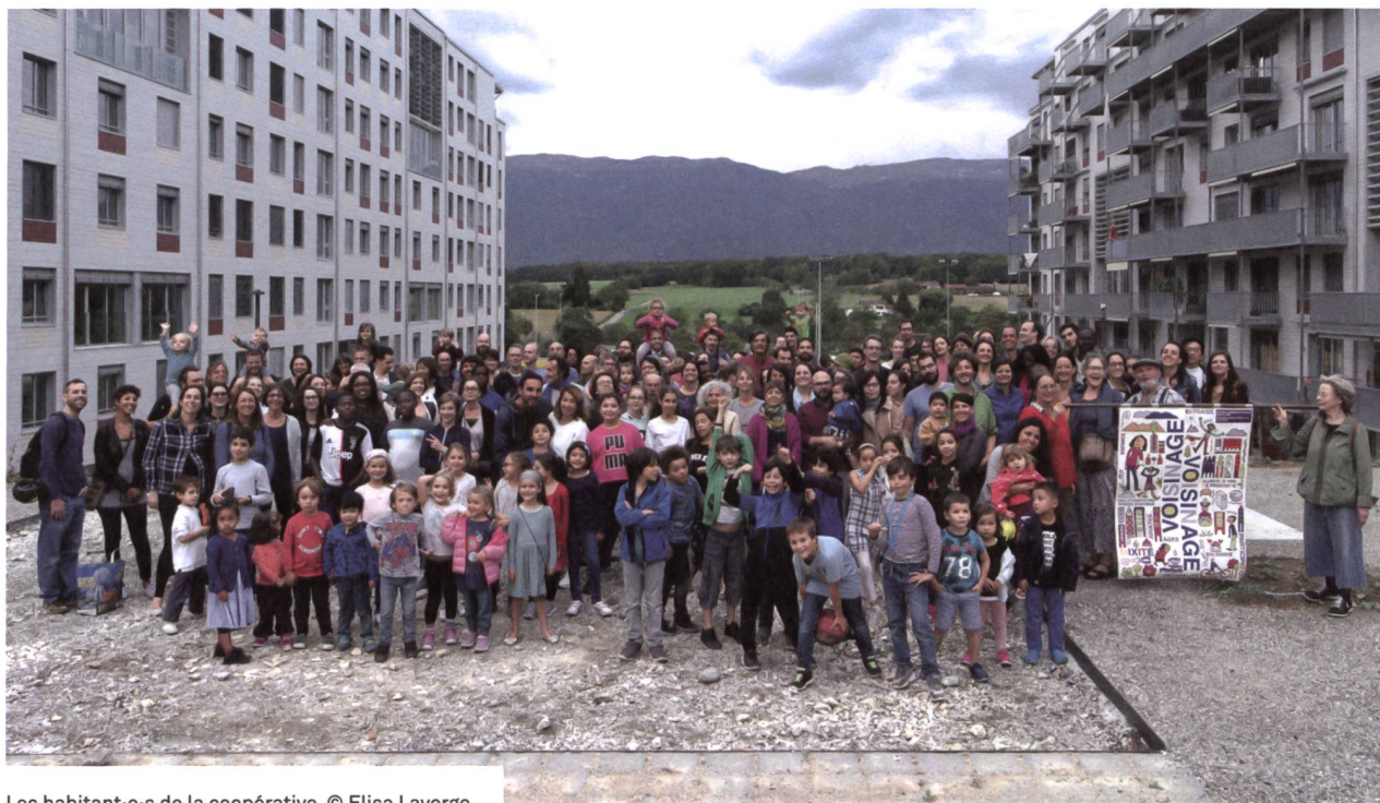
Les habitant-e-s de la coopérative.

sur plusieurs étages. Ensemble, les futurs habitants décident d'y aménager un mur de grimpe, une serre, une salle des fêtes, un atelier de bricolage, deux saunas en toiture, une salle de fitness, une salle de yoga et de danse, une bibliothèque avec des espaces de travail en mezzanine où tous les livres sont référencés, ce qui témoigne d'une belle participation pour l'aménagement des lieux. «Les coopérateurs-trices s'impliquent là où ils s'installent, c'est une source de bénévolat intarissable, précieuse pour les communes!» souligne Annick Hmidan-Kocherhans, secrétaire générale de Voisinage. Autogérés par les habitants-e-s sans distinction de provenance entre les deux coopératives, les espaces d'activités attirent beaucoup de monde, et aussi les adolescents. «Dans les nouveaux quartiers,