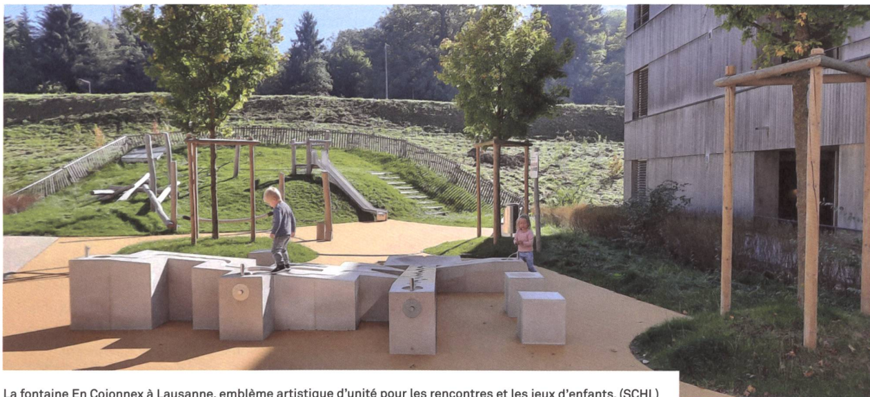
La fontaine En Cojonnex à Lausanne, emblème artistique d'unité pour les rencontres et les jeux d'enfants.

label Minergie-P-A-Eco sont évidemment plus élevés que pour un immeuble standard, mais en qualité de grande coopérative d'habitation, nous tenons à continuer de jouer un rôle de pionnier en la matière – et de toute façon, cette plus-value est un bon investissement pour l'avenir, tant pour l'aspect écologique de notre patrimoine que pour la durabilité de l'immeuble et pour les expériences que nous pourrions en tirer. Ce genre d'immeubles nécessite d'ailleurs un certain apprentissage à l'usage, que nous devons apprendre et appliquer à nos futurs sociétaires-locataires sensibles à l'environnement. Il en va d'ailleurs de même pour tous les immeubles à haute valeur énergétique que nous avons déjà construits et dans lesquels les habitant-e-s signent une charte de comportement les engageant à respecter les nécessités d'usage propres à ce genre de bâtiments. Nous venons aussi de publier une petite brochure, «La bonne énergie», afin de familiariser nos locataires avec les bonnes pratiques pour économiser l'énergie dans leur logement.