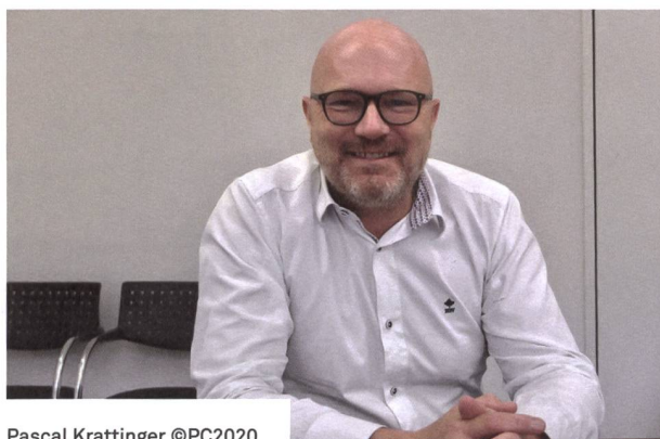
Pascal Krattinger ©PC2020

D'abord l'observatoire du logement et immobilier, qui a livré les premiers résultats pour la ville de Fribourg, et qui décortique les données de la ville de Bulle et bientôt d'autres chefs-lieux du canton de Fribourg. Parti d'un projet de recherche, l'observatoire est en phase de pérennisation, avec un modèle de sources de données inédit en Suisse, un partenariat public-privé qui fonctionne, et qui fournit avec une précision chirurgicale des informations que beaucoup attendaient depuis longtemps.