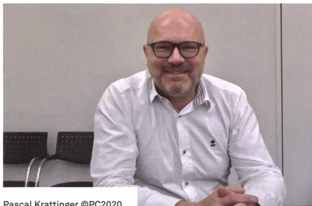
Pascal Krattinger ©PC2020

D'abord l'observatoire du logement et immobilier, qui a livré les premiers résultats pour la ville de Fribourg, et qui décortique les données de la ville de Bulle et bientôt d'autres chefs-lieux du canton de Fribourg. Parti d'un projet de recherche, l'observatoire est en phase de pérennisation, avec un modèle de sources de données inédit en Suisse, un partenariat public-privé qui fonctionne, et qui fournit avec une précision chirurgicale des informations que beaucoup attendaient depuis longtemps.