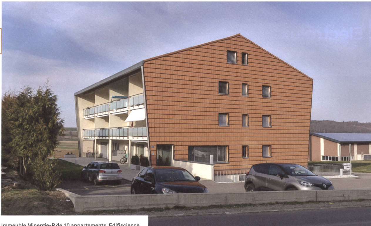
Immeuble Minergie-P de 10 appartements, Edifiscience