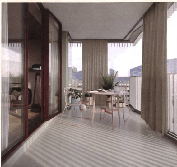
Perspective intérieure, projet d'assainissement énergétique d'une tour de 15 étages au 16-18 Vieusseux, 1203 Genève.

Le projet vise le label Minergie P rénovation. Un parc de panneaux photovoltaïques est installé en toiture afin d'alimenter l'ensemble des installations techniques de la sous-station, l'éclairage des communs, ainsi que les ascenseurs des immeubles. La ventilation mise en place est en simple flux et le chauffage est relié au CAD. La coopérative s'entoure d'un assistant à maîtrise d'ouvrage énergétique (AMOen) et d'une assistante à maîtrise d'usage (AMU) pour sensibiliser les habitants à adopter de nouveaux réflexes énergétiques dans leur nouvel écrin. L'ensemble des subventions représentent environ 12% du budget total des travaux. La demande de subvention est adressée à l'Office cantonal de l'énergie (OCEN) qui valide le bilan thermique, et donne le feu vert aux divers organismes de subventions cantonales, fédérales, et autres.