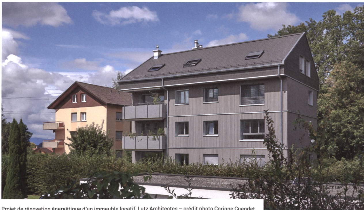
Projet de rénovation énergétique d'un immeuble locatif, Lutz Architectes

ED: Contrairement à un propriétaire privé qui pourrait profiter d'abattements fiscaux en faisant ses travaux par tranches, un MOUP a intérêt à faire tous les travaux en une fois. Les interventions se font chronologiquement dans l'ordre suivant: