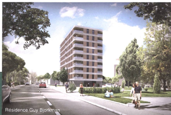
Résidence Guy Bjorkman

Plus d'information : www.flpai-geneve.ch