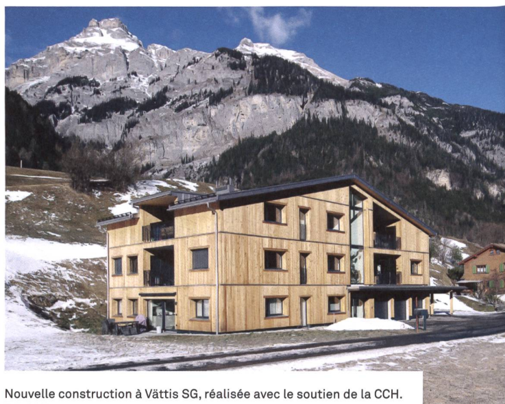
Nouvelle construction à Vättis SG, réalisée avec le soutien de la CCH.

Depuis 1957, la CCH a soutenu plus de 250 projets. Bien qu'étant la plus petite des trois institutions à l'œuvre dans la construction de logements d'utilité publique, la CCH est un partenaire