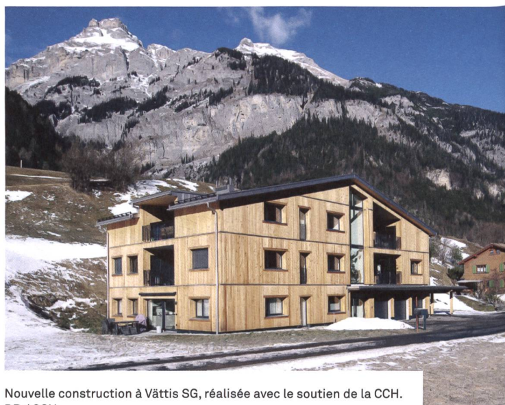
Nouvelle construction à Vättis SG, réalisée avec le soutien de la CCH.

Depuis 1957, la CCH a soutenu plus de 250 projets. Bien qu'étant la plus petite des trois institutions à l'œuvre dans la construction de logements d'utilité publique, la CCH est un partenaire