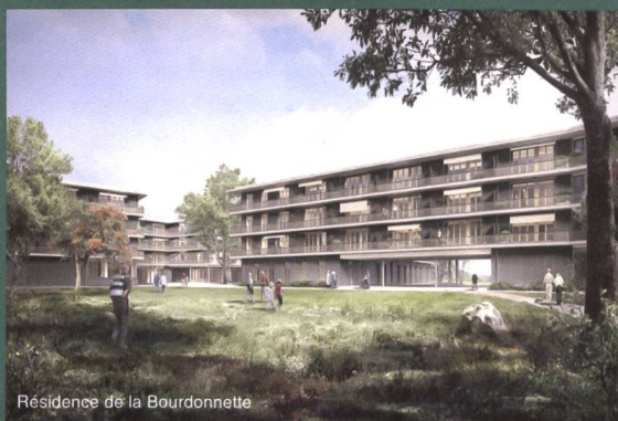
Résidence de la Bourdonnette

Vous avez plaisir à lire la revue habitation, mais vous n'êtes pas encore abonné-e.