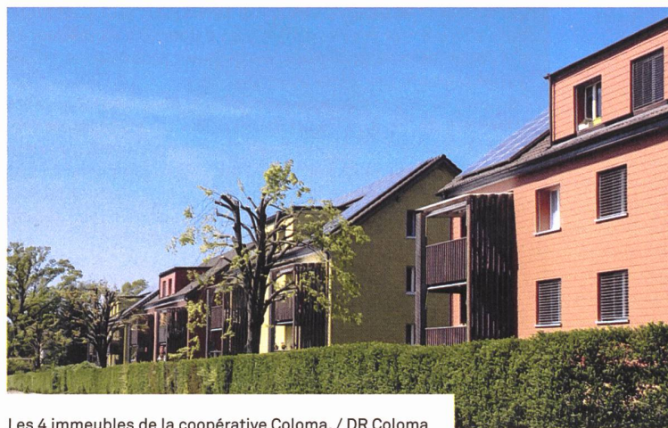
Les 4 immeubles de la coopérative Coloma.

Si Primavesta est une coopérative de taille moyenne, la coopérative Coloma à Marin-Epagnier est de taille beaucoup plus modeste. En avril 2020, elle a été en mesure de refinancer 1 million de francs de la série CCL N° 24 au moyen d'argent frais tiré du dernier emprunt – pour une durée de 20 ans. Une conversion refinancée par la CCL dans les règles de l'art à environ 40% de l'hypothèque arrivant à échéance. Grâce à cette aide, la coopérative a pu ensuite obtenir un crédit résiduel auprès de la Banque cantonale. La coopérative Coloma participe en outre à deux autres emprunts CCL.