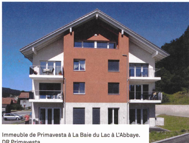
Immeuble de Primavesta à La Baie du Lac à L'Abbaye.

> Plus d'infos, argumentaire et Factsheet: http://www.egw-ccl.ch/fr/credit-cadre-2021/ .