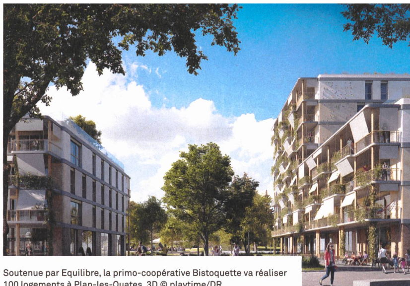
Soutenue par Equilibre, la primo-coopérative Bistoquette va réaliser 100 logements à Plan-les-Ouates. 3D © playtime/DR