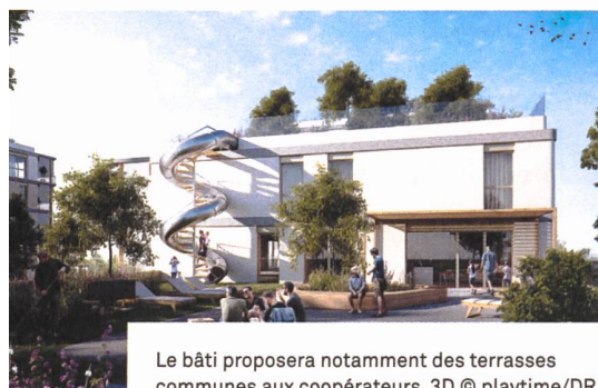
Le bâti proposera notamment des terrasses communes aux coopérateurs. 3D © playtime/DR

promues par Equilibre. Un bâti Minergie exigeant réalisé avec un maximum de matériaux naturels, garants notamment d'une très grande qualité de l'air à l'intérieur. Un système de traitement des eaux usées – toilettes y compris – sur le site. Un grand nombre de salles et d'espaces communs. Un désengagement volontaire et formel du véhicule à moteur individuel, avec parc de véhicules communs et système de réservation interne – 30 places de parking pour 100 appartements sont prévues. Sans oublier des chantiers participatifs.